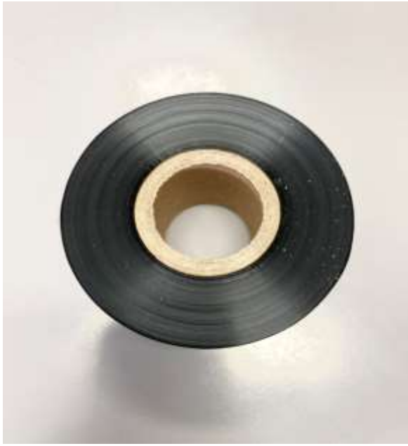
Shirita stampimi termik në rulon