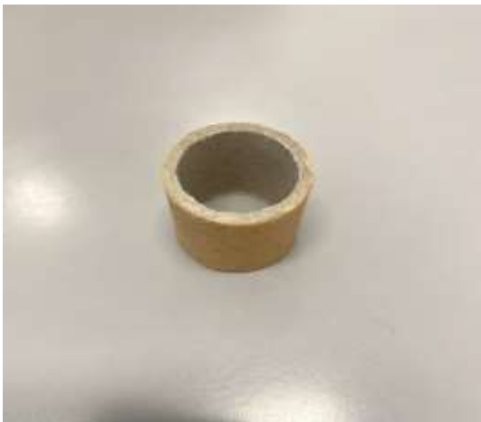
Rulon kartoni për mbledhjen e shiritit të printimit