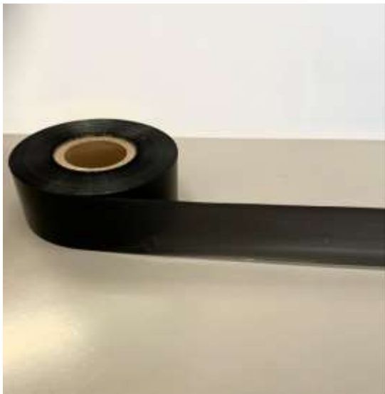
Shirita stampimi termik