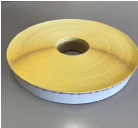
Pulla në rulon