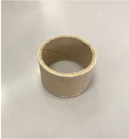
Rulon kartoni për mbledhjen e pullave