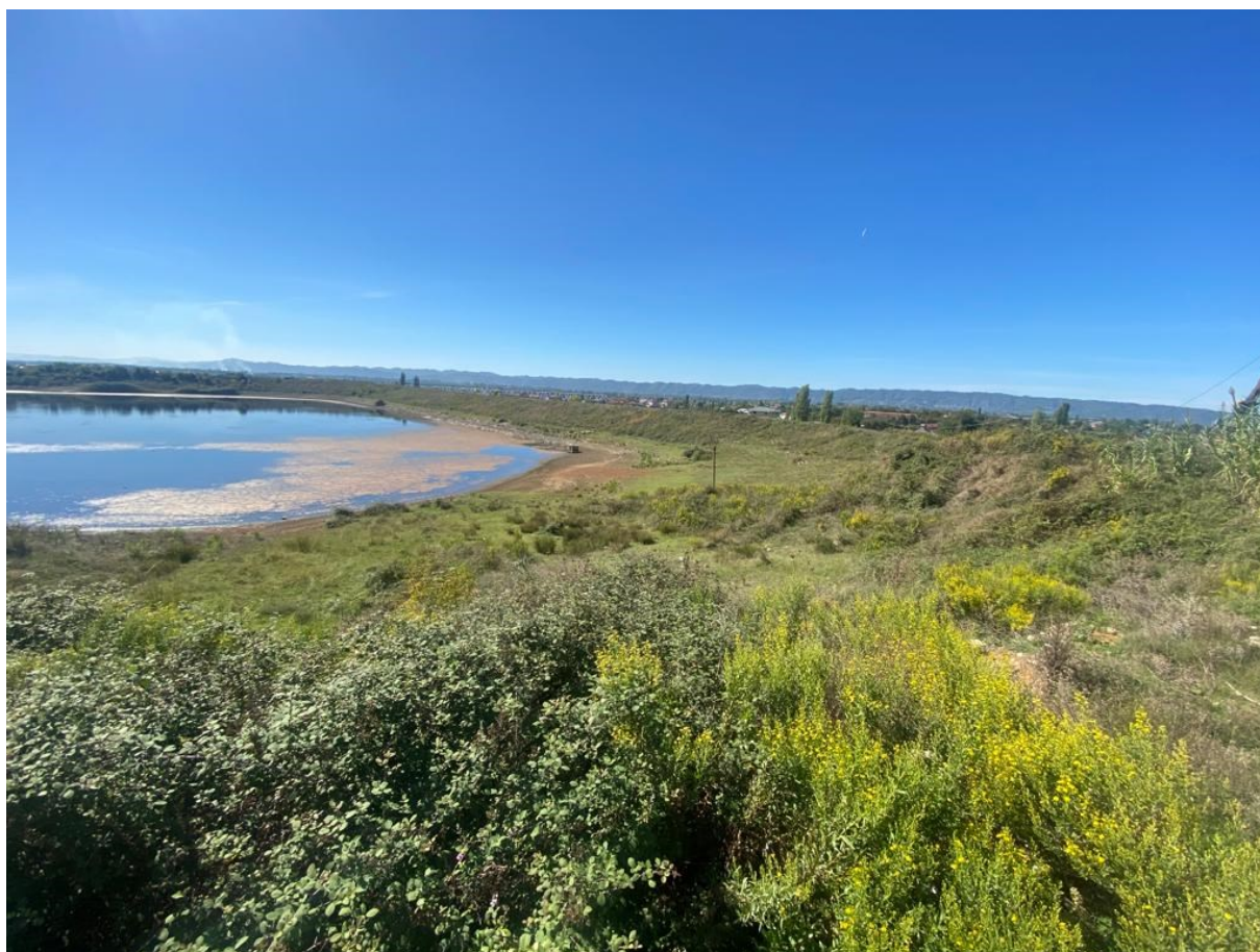
Foto. Liqeni i Thumanës