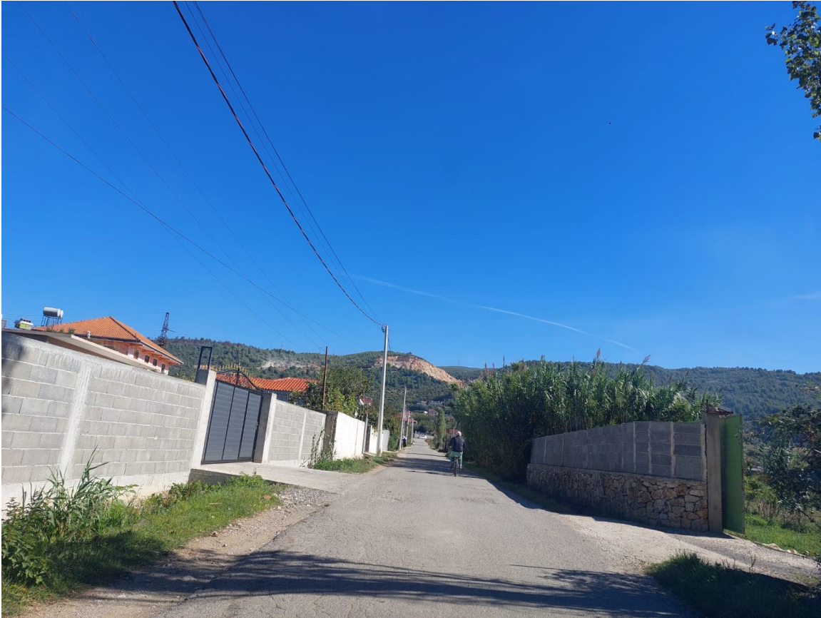
Foto. Segmenti 1, Rruga Borizanë-Superstrada Fushë Krujë-Milot