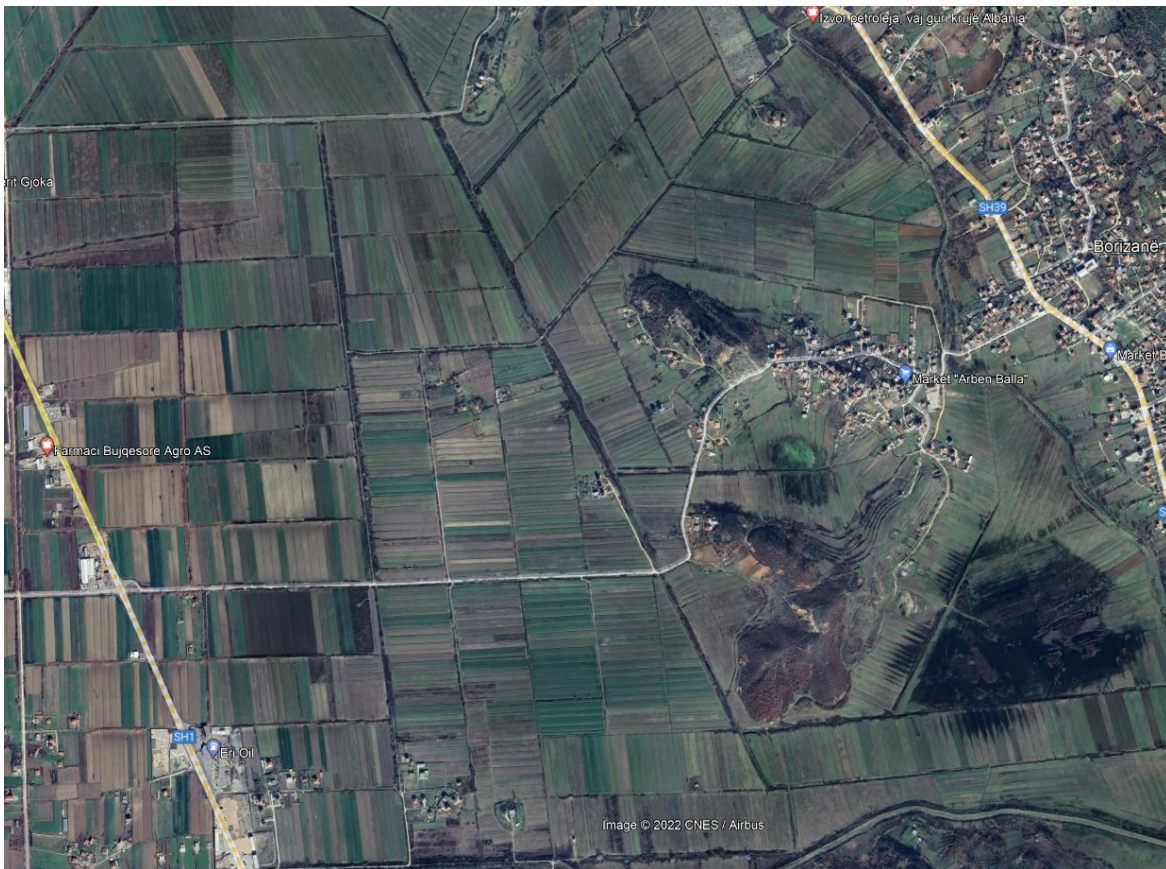
Rruga Borizanë-Superstrada Fushë Krujë-Milot