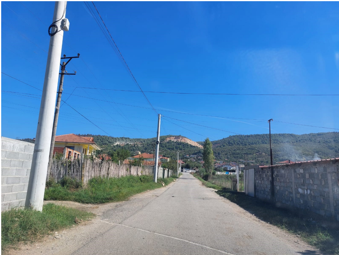
Foto. Segmenti 1, Rruga Borizanë-Superstrada Fushë Krujë-Milot d) Segmenti 2