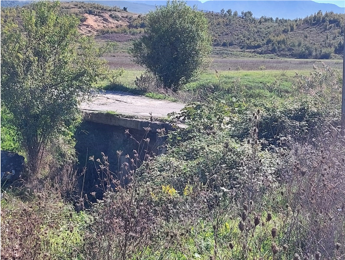
Foto. Segmenti 2, rruga Borizanë-Superstrada Fushë Krujë-Milot (Ura mbi kanalën KK1)