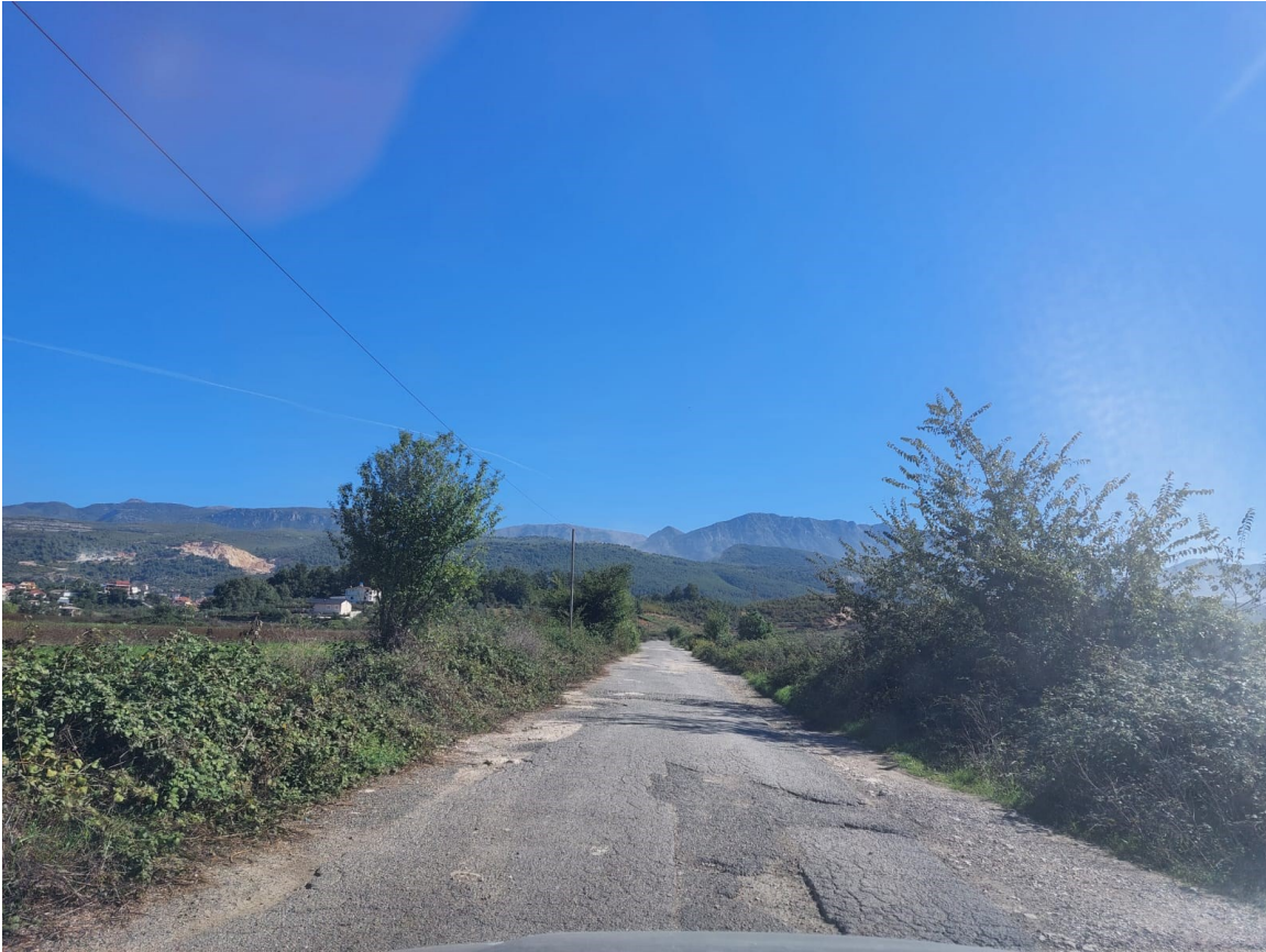
Foto. Segmenti 2, Rruga Borizanë-Superstrada Fushë Krujë-Milot