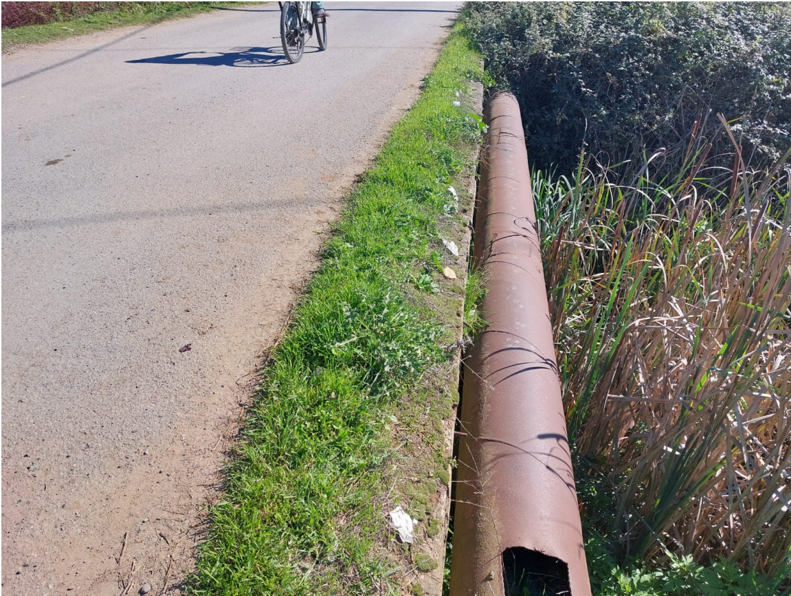
Foto. Segmenti 1, rrua Borizanë-Superstrada Fushë Krujë-Milot (Ura mbi Përroin Borizanë)

-Gjithashtu në këtë segment ka edhe vepra arti, ku më e veçanta është ura mbi përroin e Borizanës, me H_d=8\text{m} , e cila shpesh herë mbytet si pasojë e kuotës së ulët dhe e daljes së përroit nga shtrati.