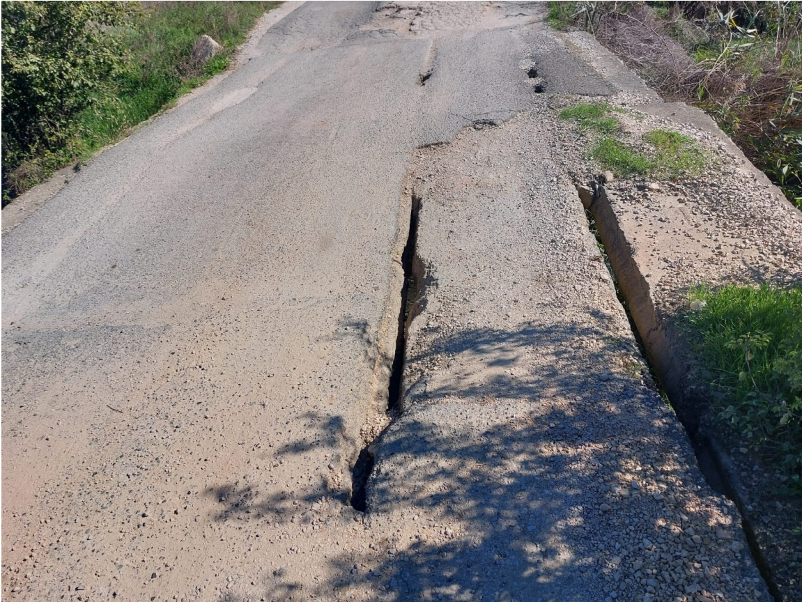
Foto. Segmenti 2, rruga Borizanë-Superstrada Fushë Krujë-Milot (Ura mbi kanalën KK1

-Gjishashtu në këtë segment ka edhe vepra arti, ku më e veçanta është ura mbi kanalën kulluese KK1 të Borizanës, me H_d=8m , e cila është e dëmtuar nga dëmtime fizike të para disa viteve, mjaft e rrezikshme për tu shfrytëzuar aktualisht, në prag shembjeje.