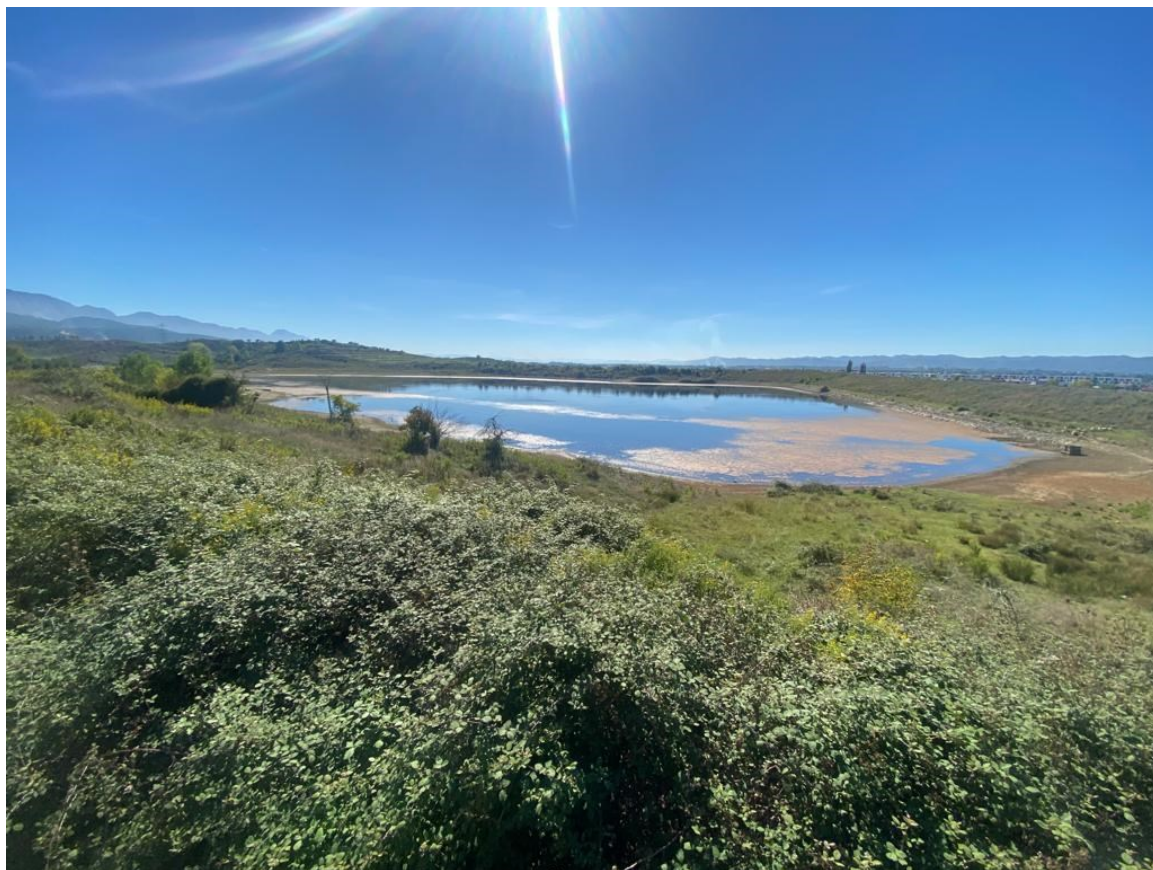
Foto. Liqeni i Thumanës