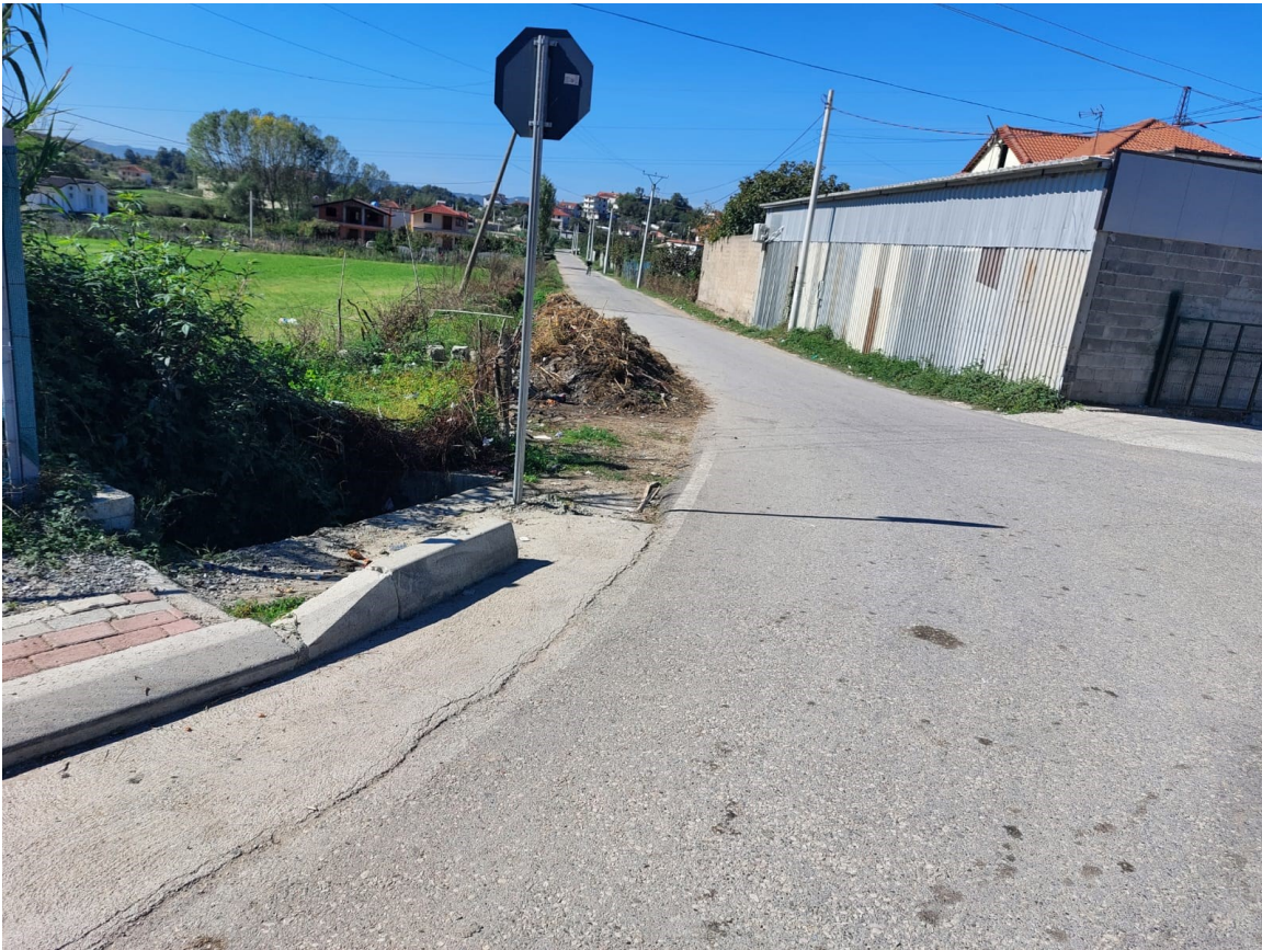
Foto. Segmenti 1, Rruga Borizanë-Superstrada Fushë Krujë-Milot (Fillimi i rrugës)

Ky segment rrugor fillon në kryqëzimin e rrugës me rrugën nacionale Fushë Krujë-Milot, fillon në një zonë me mjaft trafik dhe përfundon në skajin perendimor të varrezave të fshatit Borizanë.