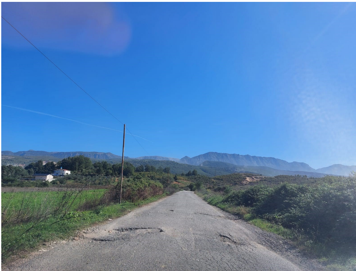
Foto. Segmenti 2, Rruga Borizanë-Superstrada Fushë Krujë-Milot