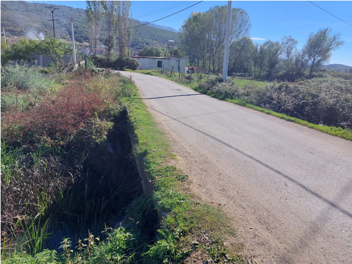
Foto. Segmenti 1, rruga Borizanë-Superstrada Fushë Krujë-Milot (Ura mbi Përroin Borizanë)