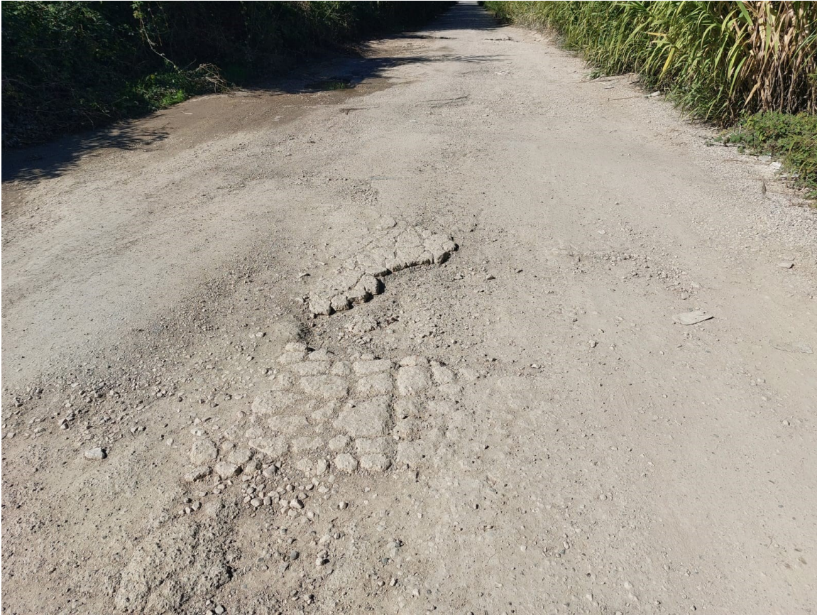
Foto. Segmenti 2, Rruga Borizanë-Superstrada Fushë Krujë-Milot