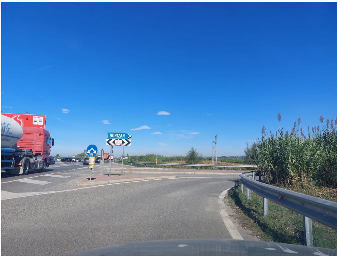
Foto. Segmenti 2, Rruga Borizanë-Superstrada Fushë Krujë-Milot (lidhja me Superstradën)

Ky segment rrugor fillon në një skajin perendimor të varrezave të fshatit Borizanë, lagja e Malmerëve (aty ku përfundon segmenti 1), përshkon rrugën lidhëse për gjatë gjithë gjatësisë dhe përfundon në një lidhëse të superstradës Fushë Krujë-Milot.