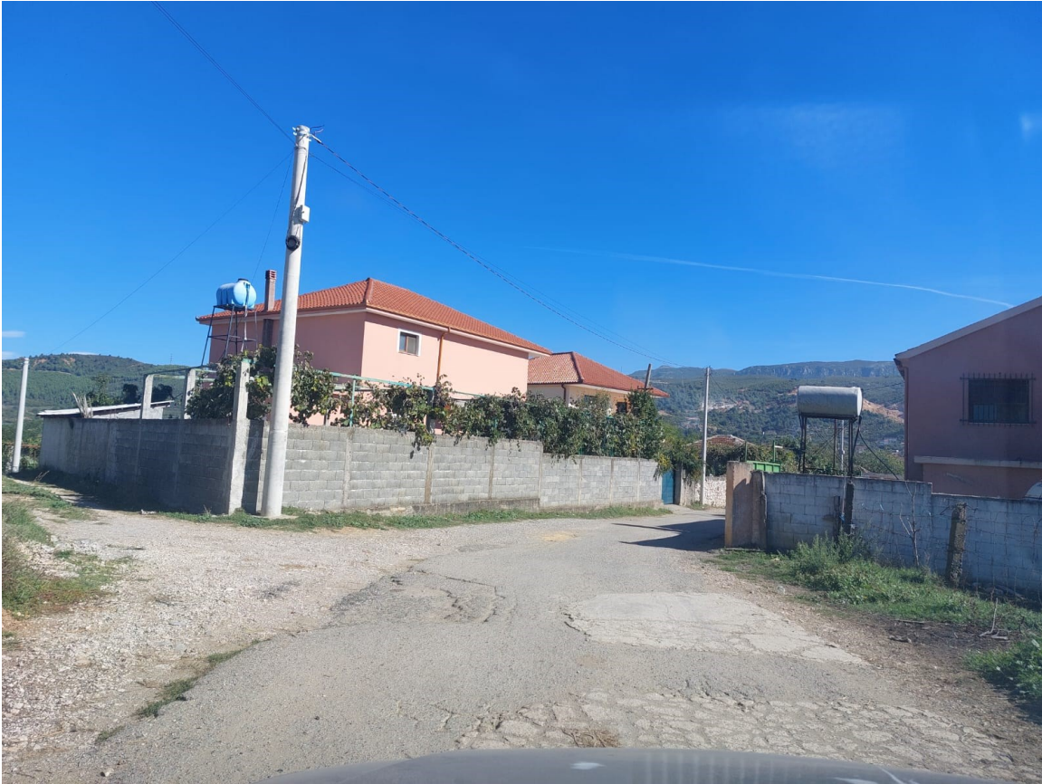
Foto. Segmenti 1, Rruga Borizanë-Superstrada Fushë Krujë-Milot