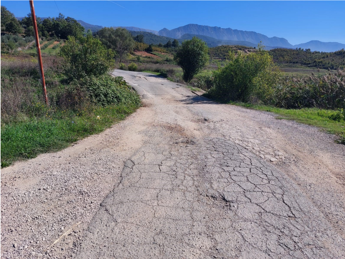
Foto. Segmenti 2, Rruga Borizanë-Superstrada Fushë Krujë-Milot