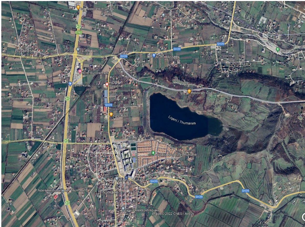
Liqeni Thumanë