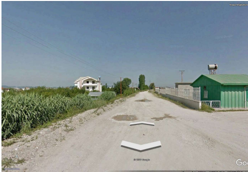
Fig. 1 Rr. Argjinatura

Zona ndodhet në Njësinë Administrative Kamez.