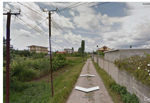
Fig. 4 Rr. Kujtesa