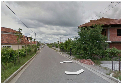
Fig. 3 Rr. Kongresi i Dibres