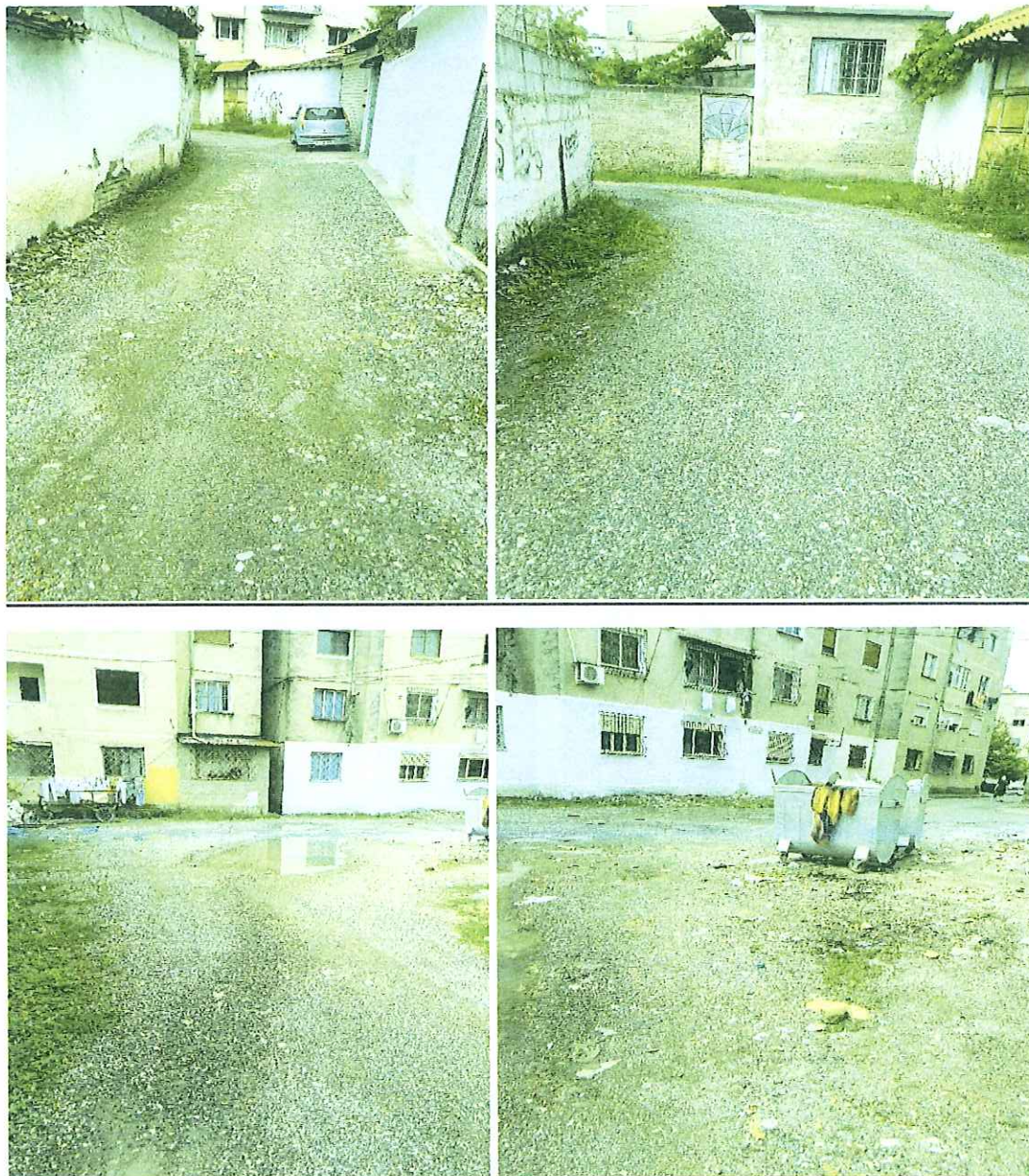
Fotografi te rruges “VELI MISIRLIU”

Rruga “VELI MISIRLIU” ndodhet ne qender te qytetit te Elbasanit ne lagjen “11 Nentori” kufizohet ne lindje me rrugen “Spiro Dedja” dhe ne perendim me rrugen “Lef Nosi”