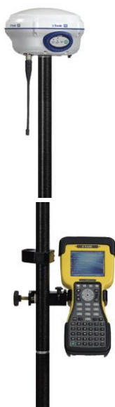
TRIMBELL R6 (gps)