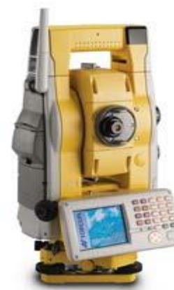
TOPCON GPT 900 A