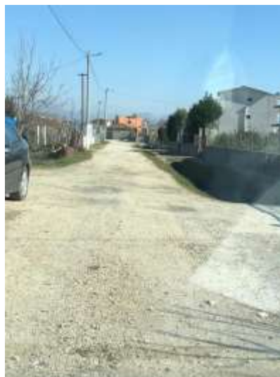
Rruga “ Kushi”