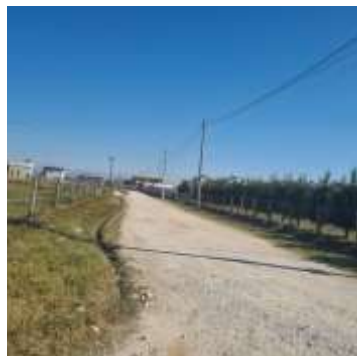
Lagjja Adriatiku (rruga “Kenete”, rruga “Demokracia”, rruga “Bytyci”, rruga “Adriatiku”, rruga “Ranore”, rruga “Istrefi”)