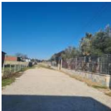
Foto të gjëndjes ekzistuese

Zona e cila do të nënshtrohet rikonstruksionit është e amortizoar. Rugët janë të pa trajtuara me pare. Gjatë kohës së shirave bëhet akoma më e vështire për lëvizjen e mjeteve. Grupi i projektimit pasi mori detyrën për rehabilitim e rrugës, oganizoi punën për realizimin e këtij projekti.