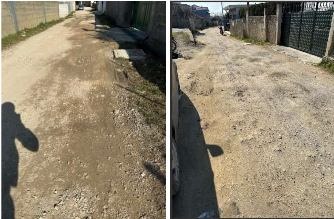
Rruga “Andon Verdha”