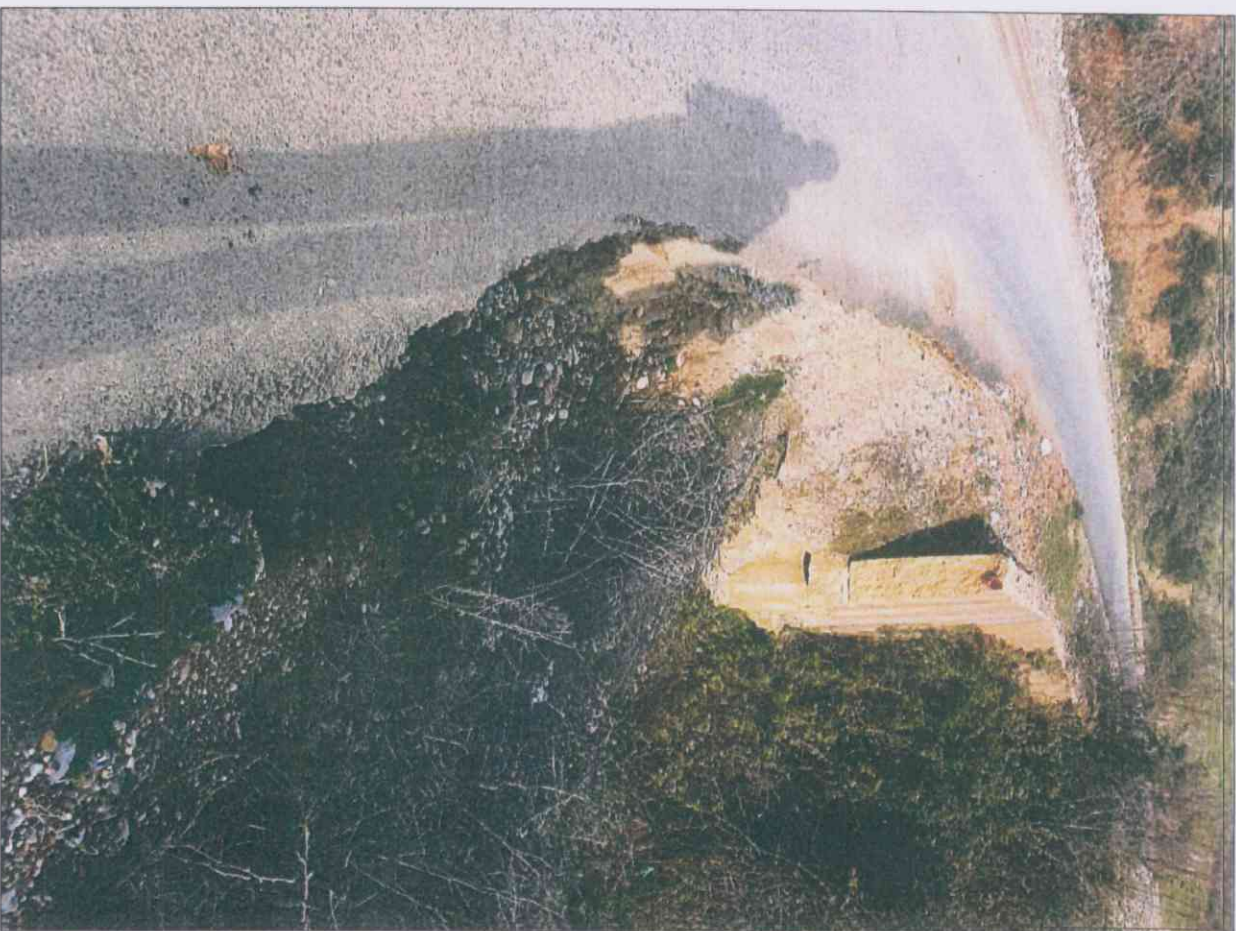
Muri 2 km 0.8-1.2 (gabion)

Ndërtim mure betoni dhe gabion në Segmentin ruogore ura Derjan – Shqipëri