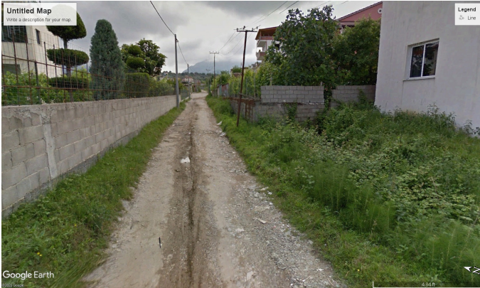
Fig. 1 Rr. 1 MAJ

Zona ndodhet në Njësinë Administrative Kamez.