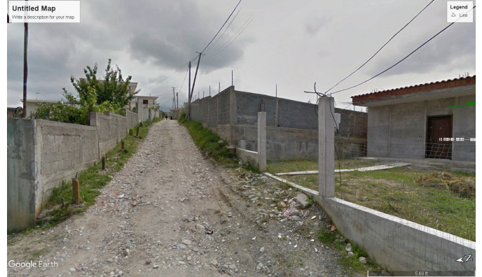
Fig. 2 Rr. 28 NENTORI