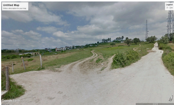
Fig. 3 Rr. MUSTAFA XHANI