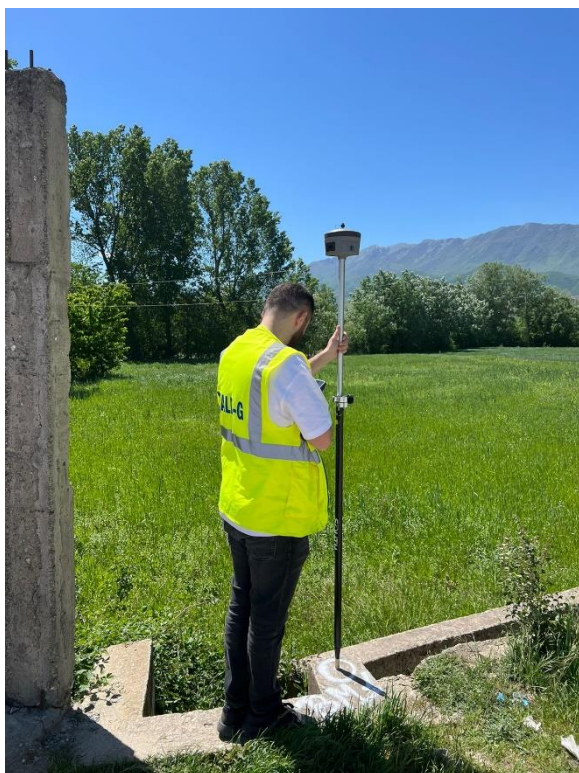
Pika e forte Nr.1 (BM1)