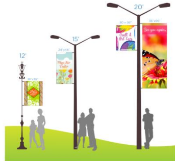
Pole Flag Sizes