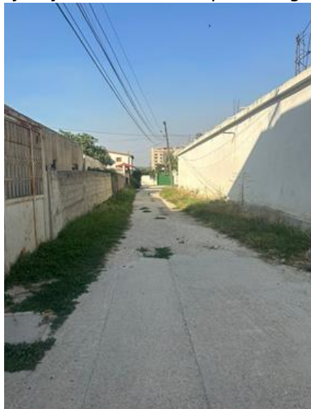
Gjendja ekzistuese e trupit të rrugës

Për realizimin e këtij projekti janë kryer studime në terren të gjendjes faktike të rrugës në të gjithë gjatësinë e saj. Mungesa e investimeve në këtë segment ka çuar në një gjendje ku nevojiten ndërhyrje të menjëhershme. Këto ndërhyrje duhet të jenë në të gjithë sipërfaqen e segmentit rrugor. Ndërhyrja e përgjithshme do të konsistojë në të gjithë gjatësinë e rrugës si dhe rindërtimi i pjesëshëm i kanaleve kulluese anësore.