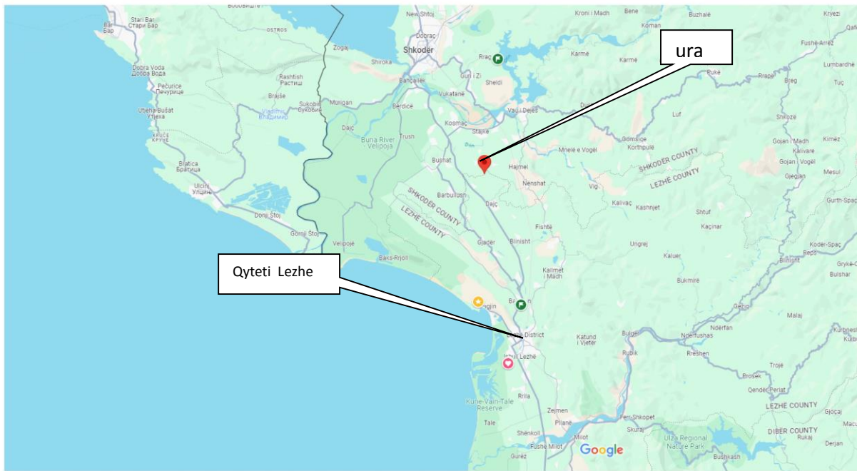
Pozicionimi i structures lidhur me qendrën e qytetit të Lezhës