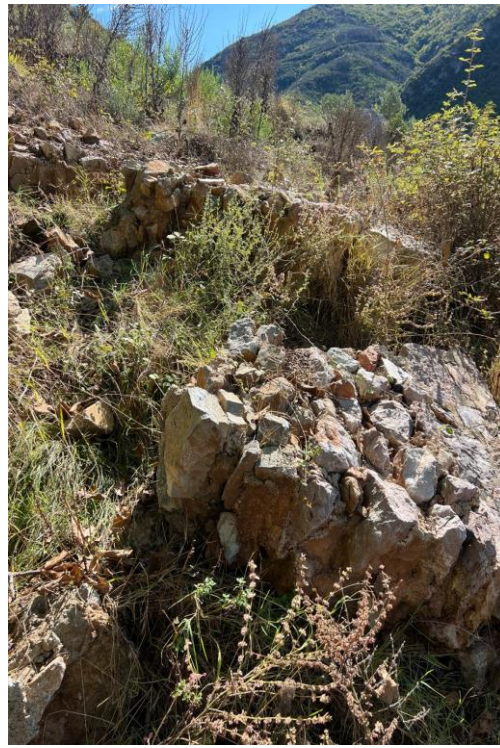
Foto te gjendjes egzistuese