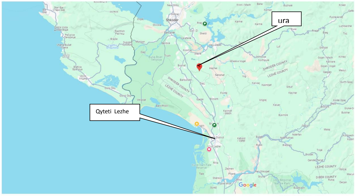
Pozicionimi i structures lidhur me qendrën e qytetit të Lezhës