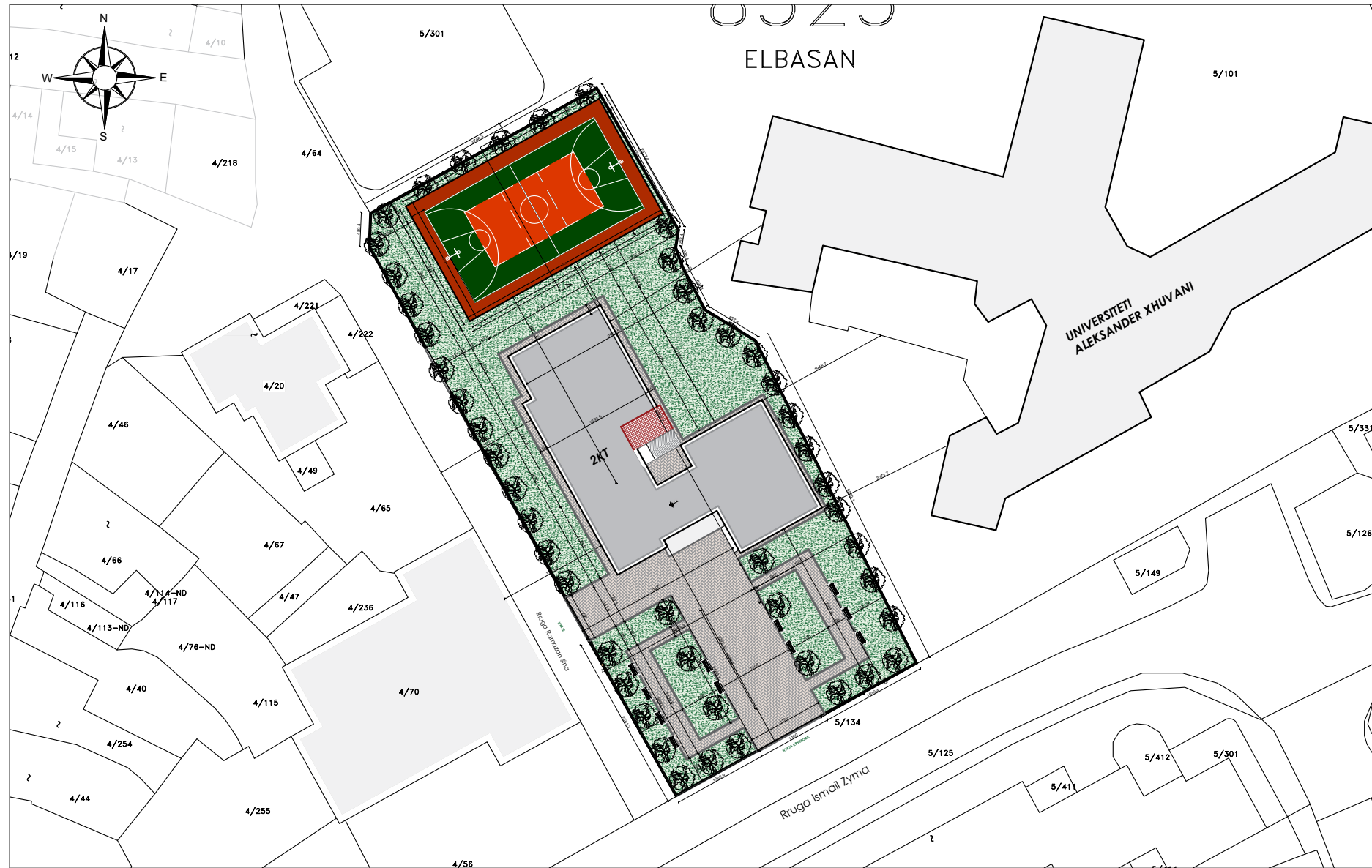
SKEMA E VENDOSJES SE ZHVILLIMIT. SHKALLA 1:2500