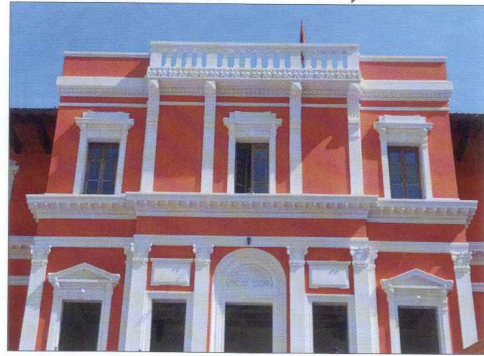
FOTO TE GJENDJES EKZISTUESE