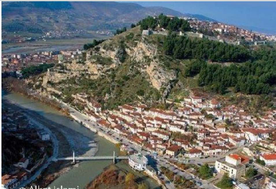
Figura 1 – Pamje e Qytetit

Turizmi është një ndër drejtimet më premtuese të zhvillimit ekonomik të Beratit. Qyteti trashëgon nga e kaluara një varg të gjatë e të pasur vlerash historike, kulturore, etnografike, arkitektonike e të besimeve, të tilla që përbëjnë një potencial të konsiderueshëm për turizmin. Me burimet turistike të qytetit është e mundur që të zhvillohet turizmi familiar dhe ai i organizuar. Në disa zona të rrethit (Tomor) mund të zhvillohet turizmi malor me shumë aspekte brenda tij, si edhe gjuetia.