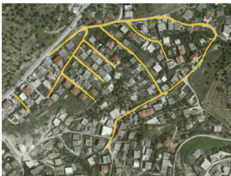
Gjendja ekzistuese e trupit të rrugës

Rrugët e sipër përmendura ndodhen në lagjen Partizani. Rrugë të brendshme të bllokut të banimit mundësojnë aksesueshmërinë e banorëve të zonës. Me gjatësi të përgjithshme rreth 2230m. E rrethuar kryesisht me shtëpi private dy katëshe dhe pjesërisht gjelbërim.