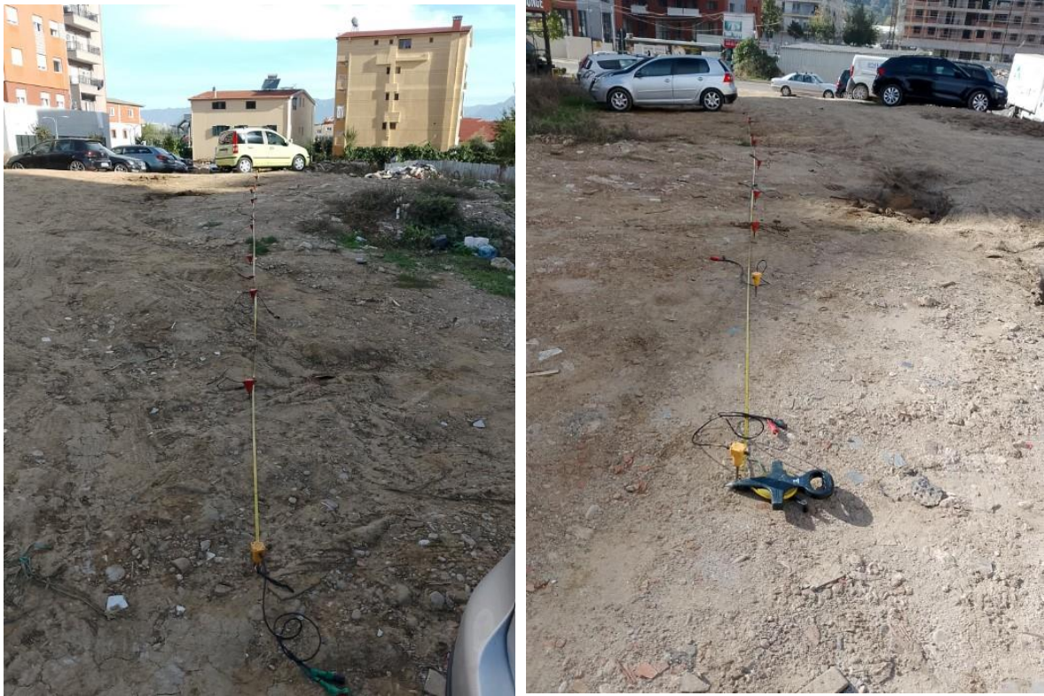
Figura 2. Pamje nga puna në objekt me metodën sizmike MASW