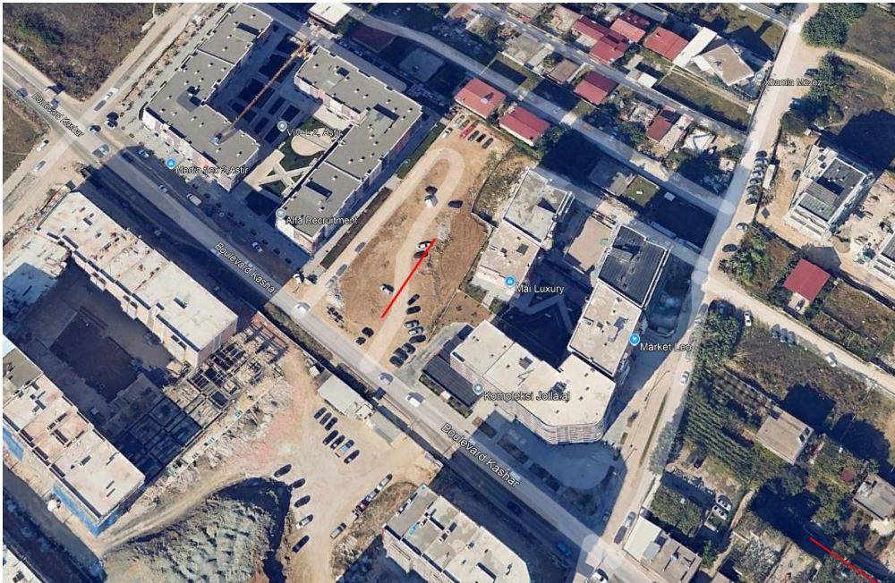
Figura 1. Ortofoto e zonës ku ndodhet sheshi i ndërtimit të objektit. Me vijë të kuqe është shënuar pozicioni i skemës së matjeve sizmike me metodën MASW

Në këtë relacion janë paraqitur të dhëna inxhiniero-sizmologjike për vlerësimin e rrezikut sizmik për projektin: "Ndërtim Kopësht Çerdhe e integruar", në rrugën "Muharrem Caushi", Njësia Strukturore KA/208, Njësia Administrative Kashar, Bashkia Tiranë. Në Figurën 1 është paraqitur një ortofoto e vendosjes së këtij objekti.