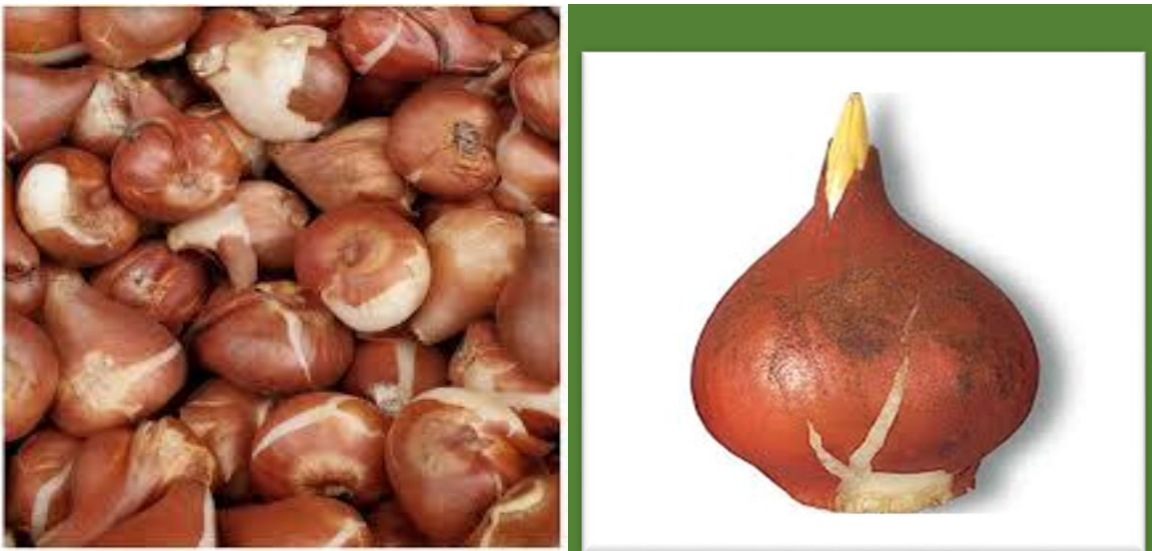
Foto me bulba të tulipanëve të llojeve të ndryshme

Tulipanët (bulbat e tyre) duhet domosdoshërisht të jenë cilësorë, bulba të pa dëmtuara apo të prekura nga kalbëzime të ndryshe, të jenë të pakëtuara sipas llojeve dhe koloreve. Ngjyrat duhet të jenë të verdha, të kuqe, lejla, blu, etj.