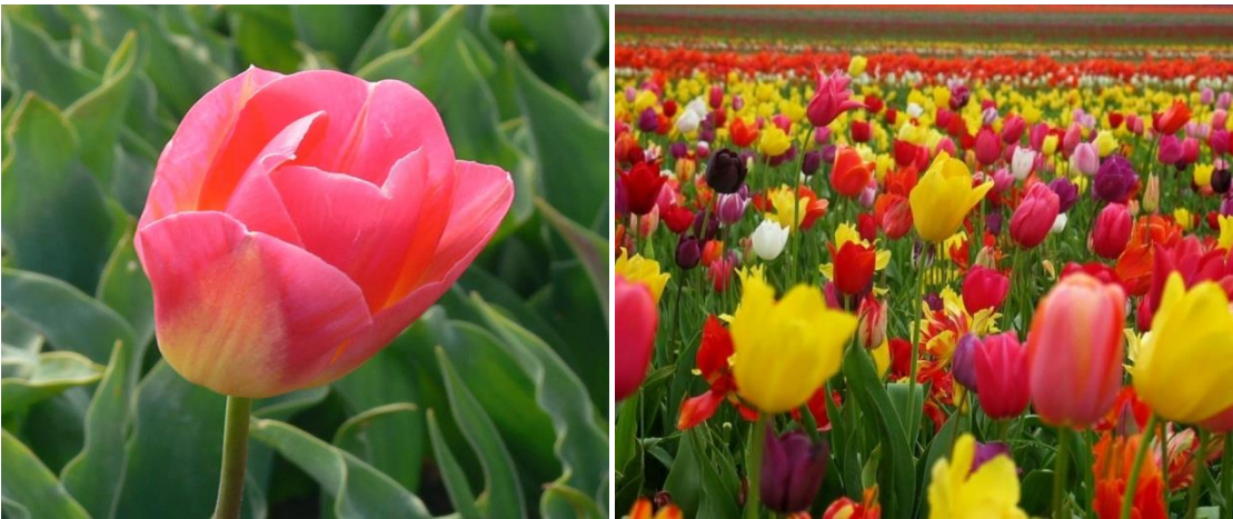
Foto me lloje të ndryshme tulipanësh

1. Tulipanët (Tulipa spp.) , janë një nga lulet më të dashura të pranverës, të njohur për ngjyrat e tyre të gjalla dhe format elegante. Me origjinë nga rajonet malore të Azisë Qendrore, tulipanët gjetën rrugën e tyre në kopshtet osmane dhe përfundimisht mahnitën kopshtarët anembanë Evropës në shekullin e 17-të, duke ndezur "maninë e tulipanëve". Sot, ato janë një simbol i pranverës dhe ripërtëritjes, i festuar në festivale dhe kopshte në mbarë botën.