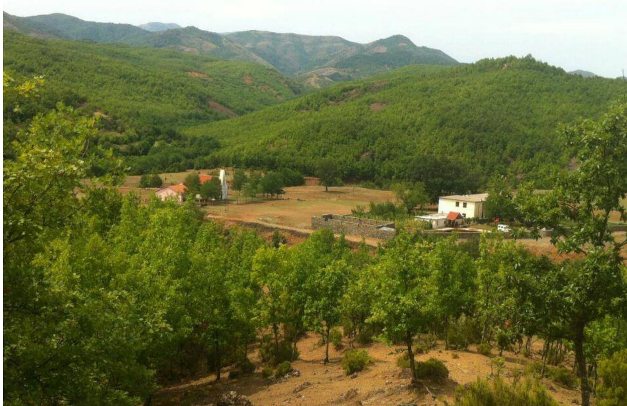
Bimesia ne zonen rreth zones

Projekti i propozuar është aktiviteti i ndërtimit të një ure në Njësinë Administrative Ungrej, Bashkia Lezhë. Kjo sipërfaqe ndodhet në zonën e Perroit të Ungrej. Terreni është kryesisht me reliev të thyer dhe karakterizohet nga toke flishore, të cilat ndodhen pranë faqeve të kodrave ose me sakte në deluvionet e formuara mbi flish.