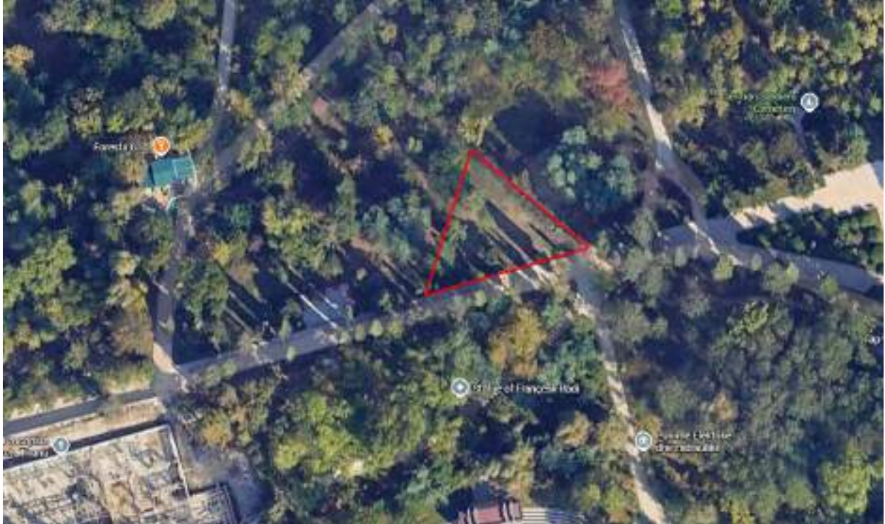
Ortofoto të gjendjes ekzistuese