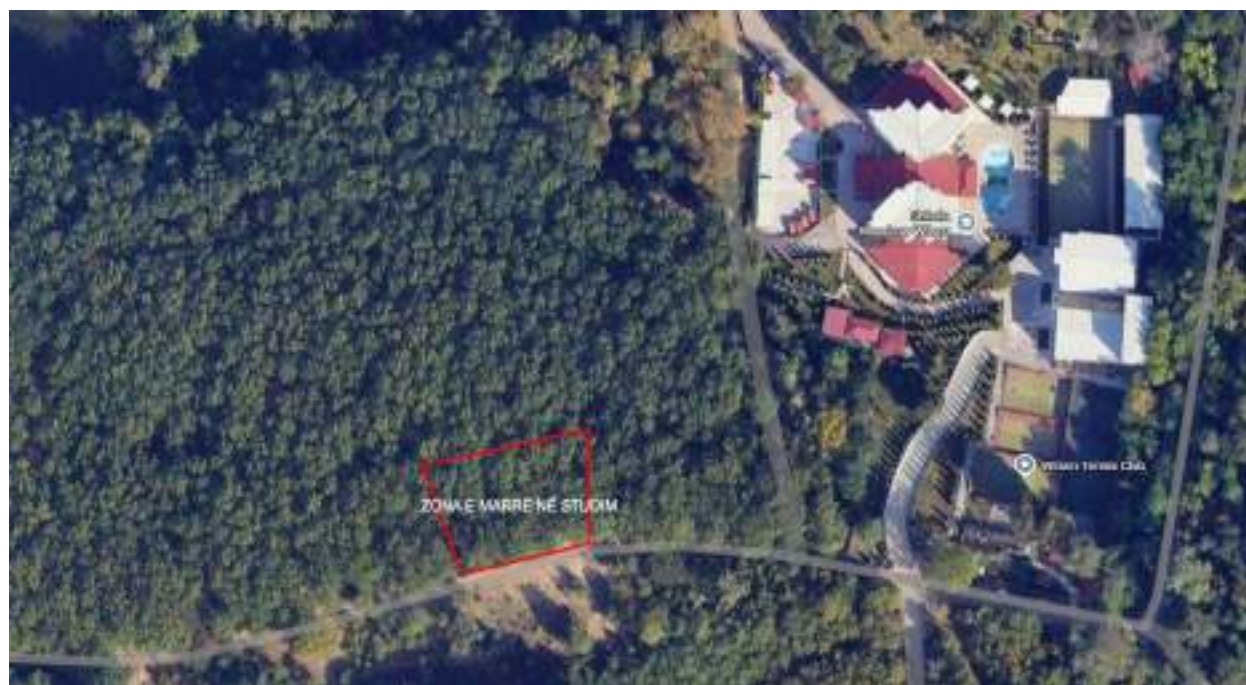
Ortofoto të gjendjes ekzistuese