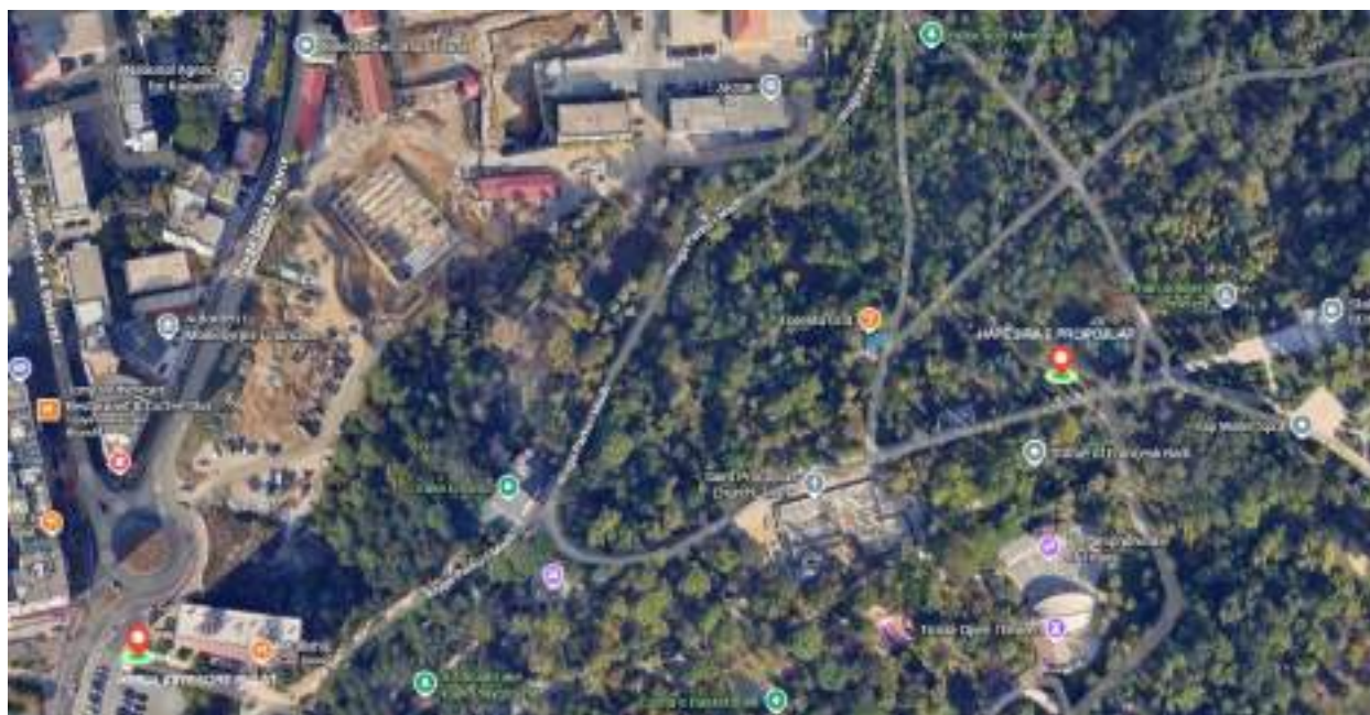
Ortofoto të gjendjes ekzistuese

Hapësira e propozuar për “Pasqyrën e dijes” ndodhet në afërsi të hyrjes kryesore të PMLAT, në një distancë rreth 450 m linear prej saj, buzë pedonale kryesore, duke e bërë këtë zonë mjaft të përshtatshme për akses maksimal nga çdo kategori. Zona ka një pozicion mjaft të favorshëm duke qënë se ndodhet në një reliev të sheshtë dhe në kryqëzimin e katër pedonaleve.