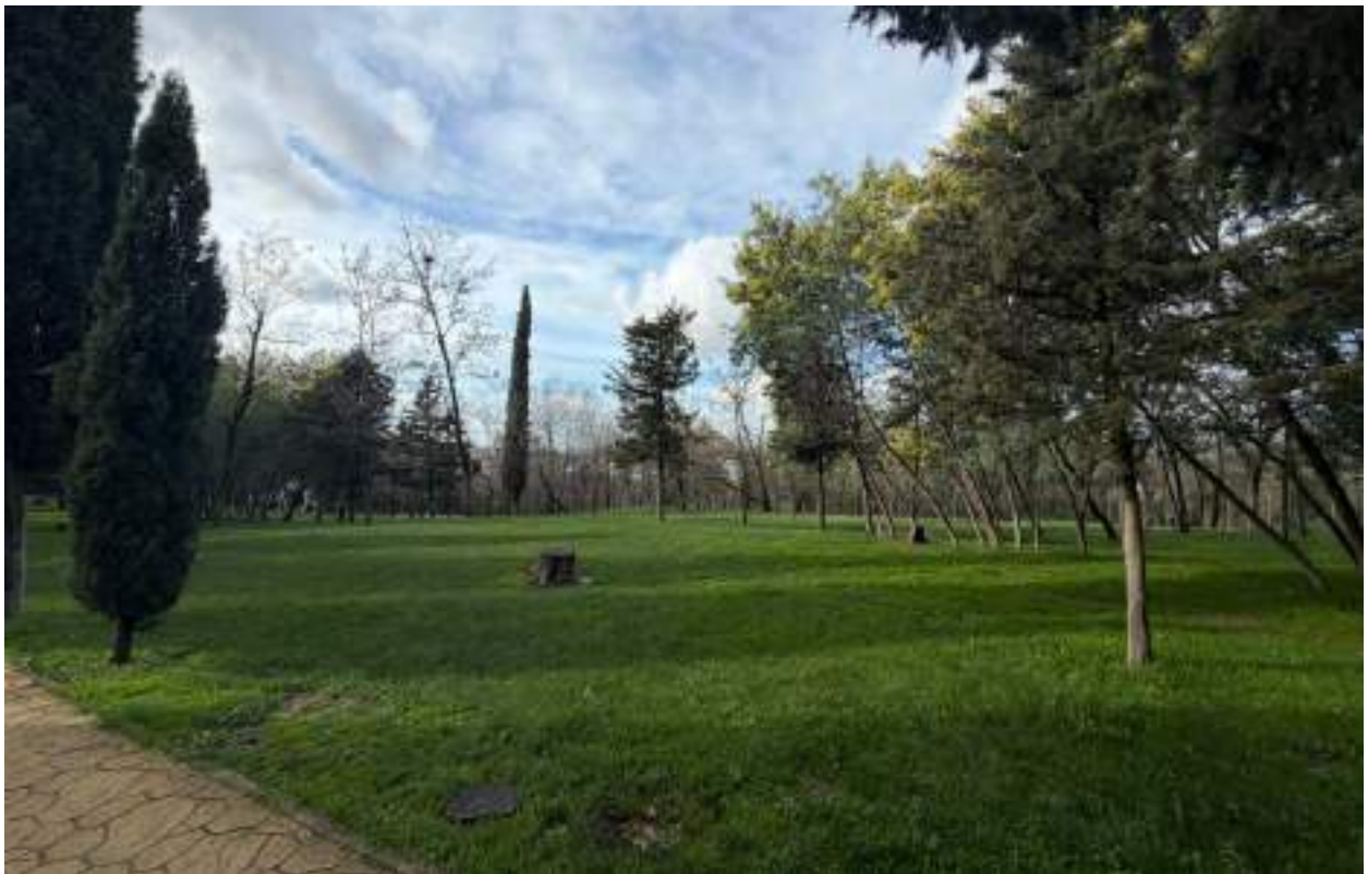
Foto të gjendjes ekzistuese