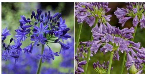
Foto ilustruese e Agapanthus