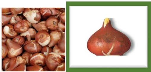
Foto ilustruese me bulba tulipanësh të llojeve të ndryshme