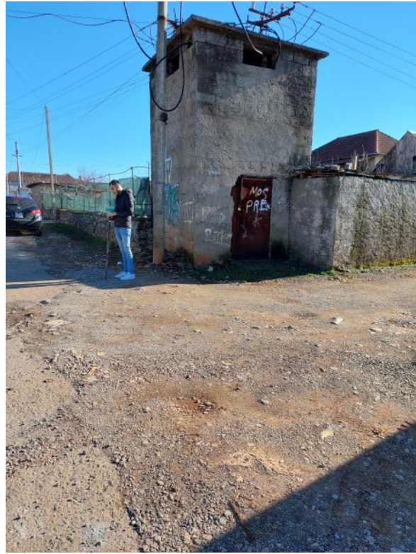
Ne foto : Gjendja ekzistuese