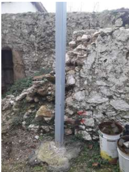
FOTO TË GJENDJES EKZISTUESE