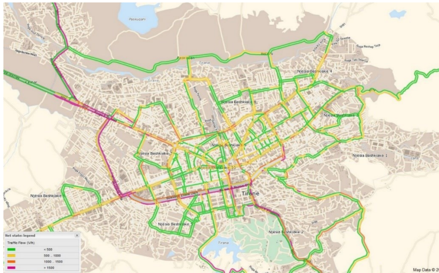
Figure 0.2 -Rrjeti i trafikut në Tiranë.

Aktulisht akset kryesore të qytetit të Tiranës janë rikonstruktuar apo zgjeruar. Ndërkohë që ndihet nevoja e hapjes së rrugëve dhe koridoreve të reja të lëvizjes. Problematike gjithashtu paraqiten rrugët dytësore dhe tretësore në brendësi të blloqeve të banimit. Të cilat ndikojnë direkt në qarkullimin dhe cilësinë e jetesës së banorëve të tyre si të të mbarë qytetit në tërësi. Në këtë kuadër Bashkia e Tiranës, ka planifikuar përgatitjen e një sërë projektesh për rikonstruksionin dhe rikualifikimin urban të një sërë blloqesh banimi apo segmenteve rrugore. Trajtimi i blloqeve, segmenteve rrugore do të jëtë i plote në të tërë komponentet e nevojshem. Ndër këto segmente rrugore dhe blloqe banimi, është edhe objekti që do trajtohen nga ky projekt.