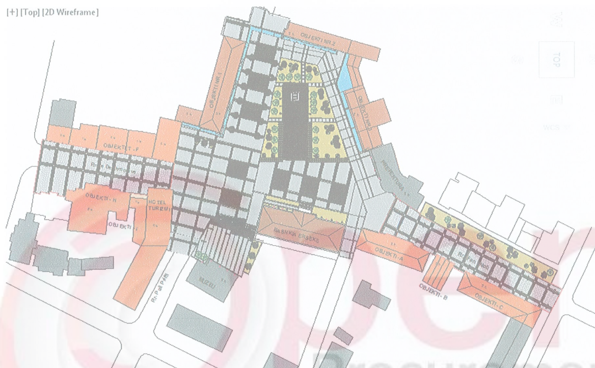
Figura 1 : Sheshi Rilindja me zgjatimet e rrugeve qe do te kthehen ne pedonale