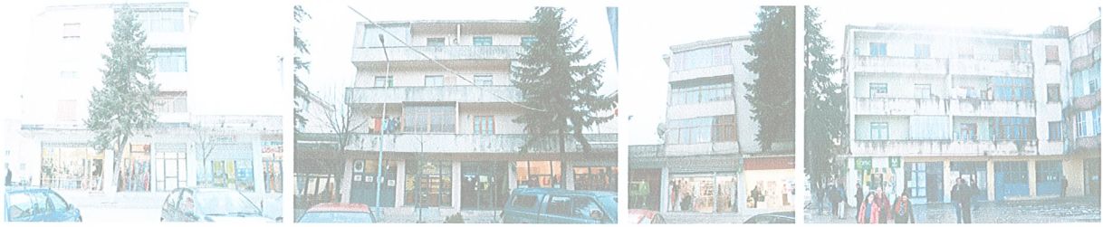
Figura 5: Blloku i objekteve F