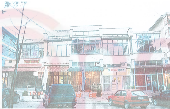
Figure 6: Objekti H (2-katesh)

Edhe objekti H (2-katesh) do të ketë gjithashtu fasada të pastruara dhe lyera me boje. Edhe për këte rast, si me rastet e tjera, ngjyrat do të vendosen nga arkitektet pas aprovimit të mostrave.