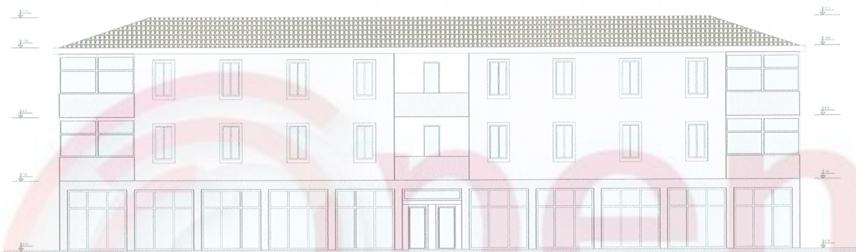
Figure 4: Objekti C, gjendja ekzistuese dhe projekti i fasades ballore