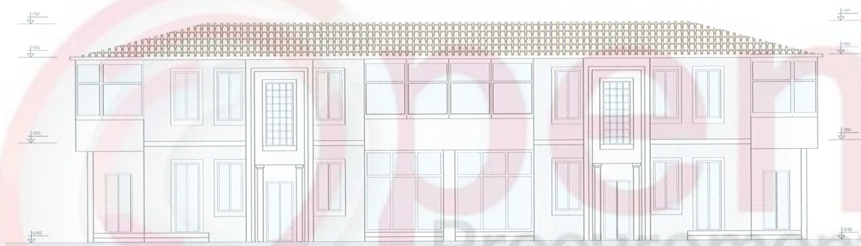
Figura 3: Gjendja ekzistuese dhe projekti i fasades se objektit A