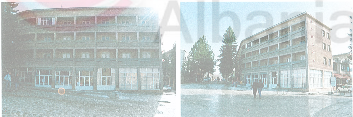
Figure 8: Gjendja aktuale e Ish Hotel Turizmit

Ndertesa e ish Hotel Turizmit funksionon sot si hotel i privatizuar. Per nga pozicioni i tij ne shesh, fasadat e hotelit do te pastrohen me furce, duke i kthyer keshtu pastertine dhe shkelqimin e tij te dikurshem.