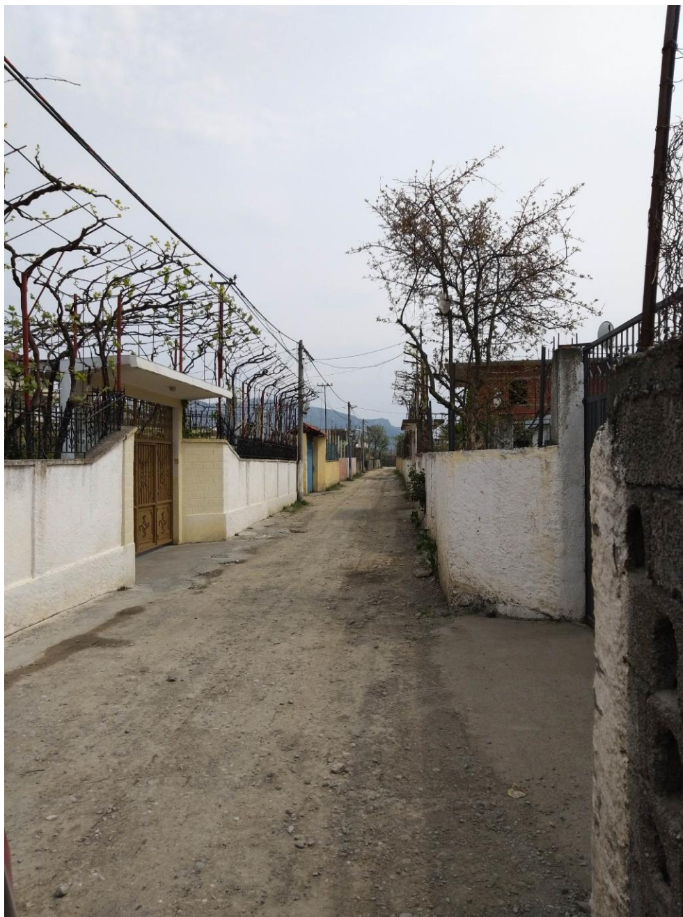
Pamje ekzistuese nga rruga

Pershkrimi gjurmes se rruges: Ne kete segment parashikohet ndertimi i nje rruge me gjeresi asfalti 2.75m, kunete betoni 50cm dhe dy trotuare me gjeresi variabel. Paketa asfaltike kufizohet me bordura 20x35 qe te siguroje qendrueshmerine e shtresave. Trotuaret do te jene te veshur me pllaka betoni 6cm. Pergjate rruges eshte parashikur te vendoset ndricim me shtylla me lartesi 7m, te vendosura ne forme zig-zag. Ndriculesit do te jene ndricues te tipit LED 4500lm IP65. Pergjate rruges eshte parashikuar te vendoset dhe infrastruktura per rrjetet e internetit dhe telefonise, duke parashikuar vendosjen e tre tubave sipas standardit shqiptar.