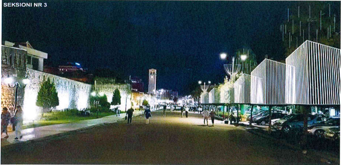
SEKSIONI NR 3

Gjithashtu është menduar sheshi përpara Kalasë të marri trajtën e një miniqyteti I cili do të jetë I zbukuruar me objekte dekorative si dhe vendosjen e simbolit të festave të fundvitit pemën e krishtlindjeve.