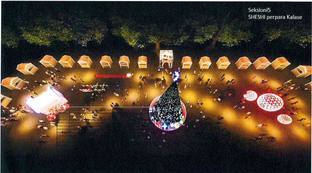
Seksioni5 SHESHI përpara Kalase

Gjithashtu është menduar sheshi përpara Kalasë të marri trajtën e një miniqyteti I cili do të jetë I zbukuruar me objekte dekorative si dhe vendosjen e simbolit të festave të fundvitit pemën e krishtlindjeve.