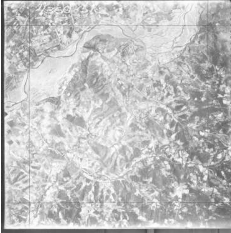
Fig.1 – fotografi ajrore Viti 1957