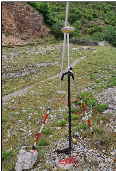
TopCon Hipper VR