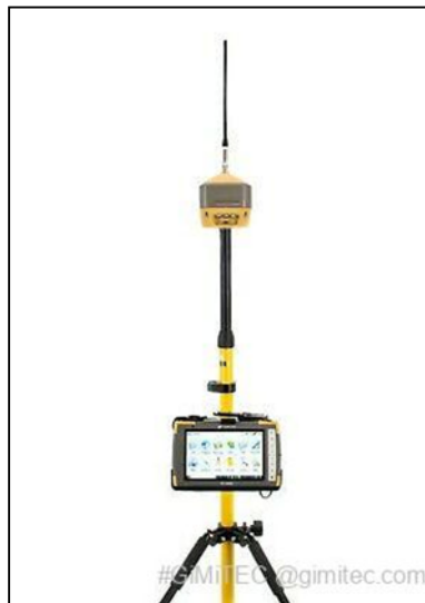
TopCon Hipper HR