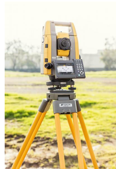
TopCon GT 503