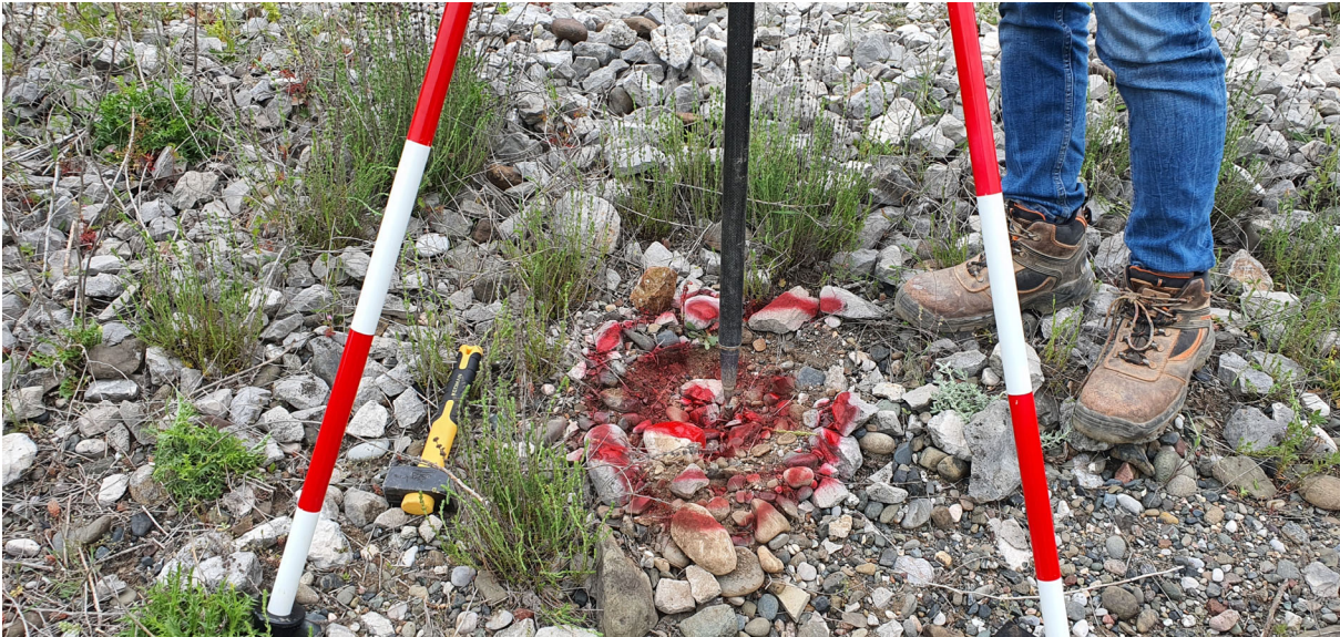
Foto Gjate Matjeve ne Terren