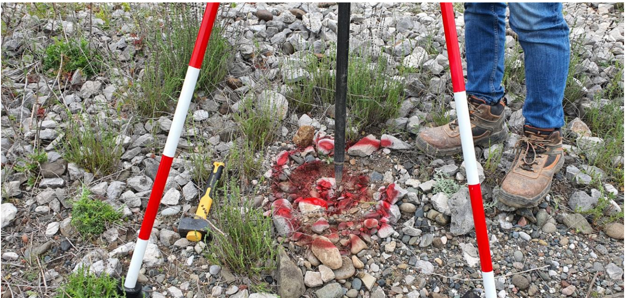
Foto Gjate Matjeve ne Terren