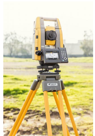
TopCon GT 503