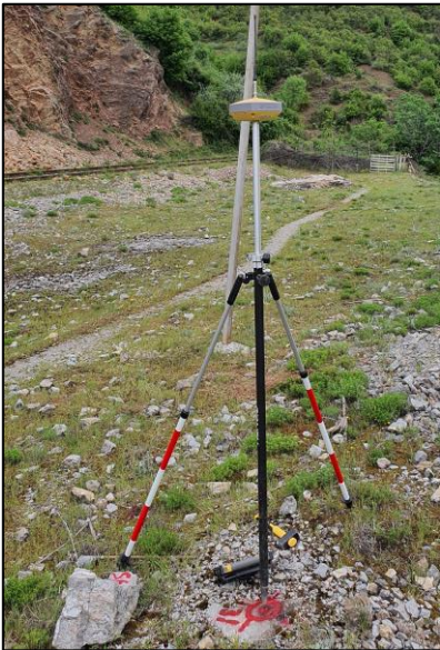
TopCon Hipper VR