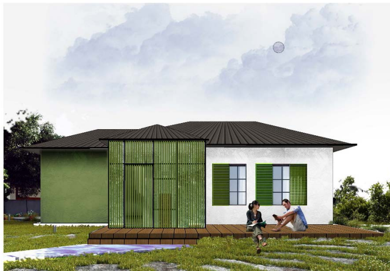
Figure 4 PAMJE E FASADES_MODEL 1

Fasadat e shtëpive do të trajtohen me ngjyra të ndryshme bazuar në paletën e propozuar. Ku panelet fibër-çimento me teksturë guri në exterior apo të lëmuar në interior, do të lyhen me bojë hidroplastike sipas kodeve të paracaktuara në paletë. Me të njëjtën logjikë do të trajtohen edhe elementët hijëzues.