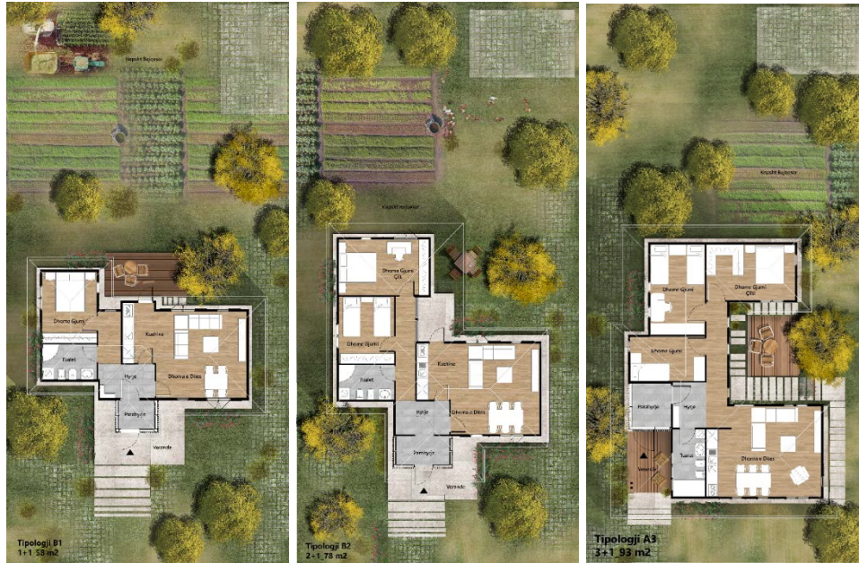
Figure 4 TRE TIPOLOGJITË E SHTËPIVE

shpërndarëse midis dhomës së ditës dhe dhomave të gjumit. Secila tipologji ka një kuzhinë, e cila është e paisur me instalimet e nevojshme për lavapjatë dhe lavastovilje. Nga kuzhina dhe dhomat e ditës ka dalje në oborrin e pasmë të shtëpisë. Tualeti përfshin WC, lavaman, dush, dhe instalimet e nevojshme për ngrohës uji dhe makineri larëse. Hapësirat e brendshme do të shtrohen me pllakë për tualetin, hyrjen dhe kuzhinën, dhe me parket për dhomën e ditës dhe dhomat e gjumit.