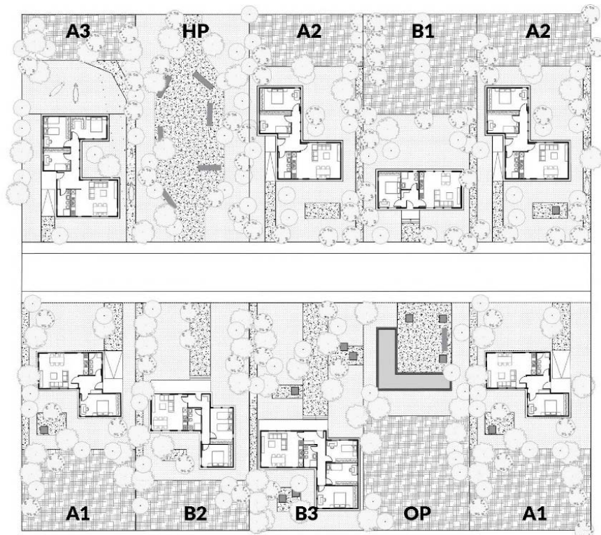
Figure 1 ORGANIZIM SKEMATIK I MODELEVE

Shtëpitë aksesohen nga fasada kryesore e cila është e orientuar nga rruga e cila lidh këto module me njëra tjetrën dhe pjesën tjetër të zonës. Përpos oborrit të përpamë, shtëpitë kanë edhe një oborr të pasmë i cili aksesohet në mënyrë direkte nga ambientet e brendshme. Ky oborr lidhet me një kopsht individual i cili do të përdoret për prodhim bujqësor. Pas ndërtimit të secilit objekt do të realizohet plansistemimi i oborrit rrethues dhe kopshtit bujqësor, me ambiente të gjelbëruara, shtrim me materiale natyrore dhe infrastrukturën e nevojshme bujqësore.