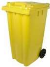
Foto 10. Idealisht, mbetjet duhet të transportohen në konteniere prej plastike të durueshme dhe me rrota

Në pikën 9.1 (faqe 28 - 29) të Udhëzuesit - Shërbimi i grumbullimit