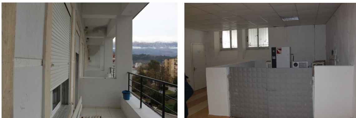
Fig.7 _ Ballkonet (majtas) dhe Hapësira e podrumit (djathtas)