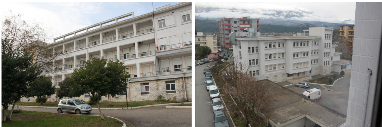
Fig.3 _ Hyrje e Spitalit (majtas) dhe Hapësira e maternitetit (djathtas).