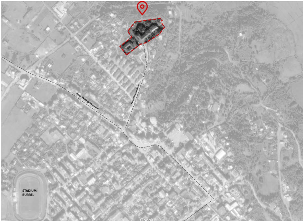
Fig.1 _ Foto ajrore e Kompleksit Spitalor