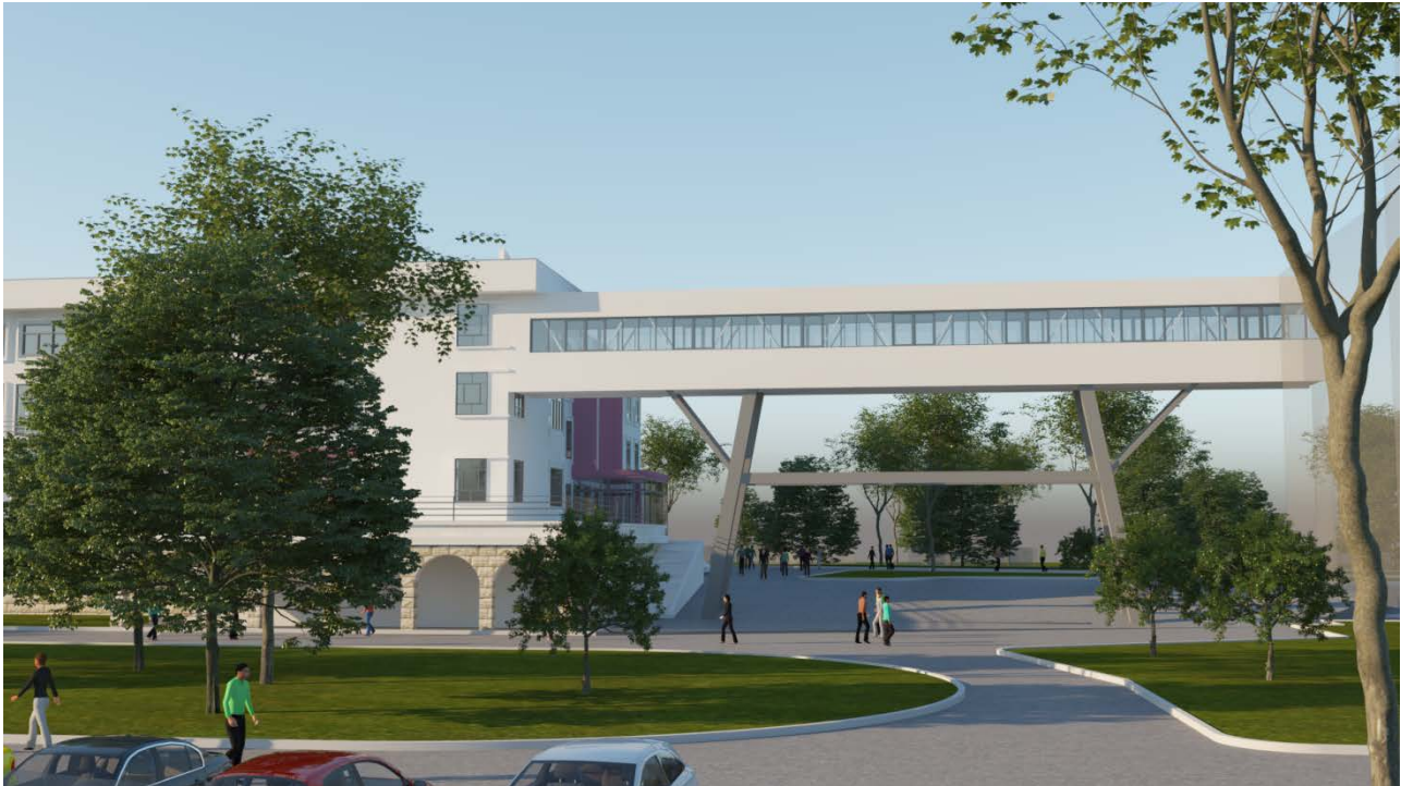
Fig.5 _ Pamje nga ura lidhese