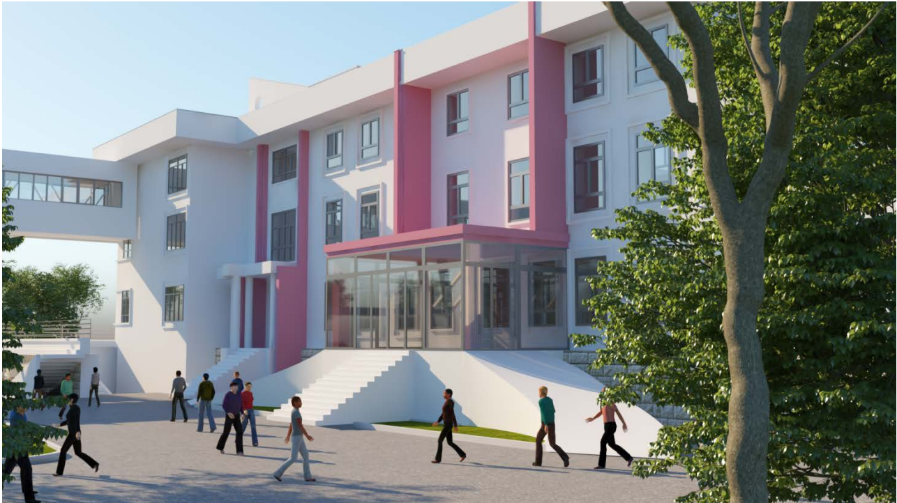
Fig.4 _ Fasada kryesore e spitalit

Funksionet ne godinë nuk do te ndryshojne, por do të riformulohen funksionet ekzistuese. Dhomat e pacienteve jane programuar me tualet te vecante dhe gjithashtu me max 2 krevate per dhome.