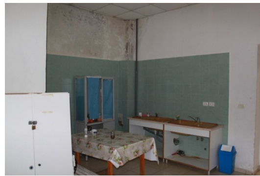
Fig.5 _ Dhomë pacienti (majtas) dhe Kuzhina (djathtas)