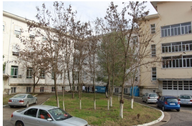
Fig.2 _ Hyrje kryesore e Urgjences(majtas) dhe Hyrja dytesore e spitalit (djathtas).