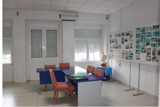
Fig.4 _ Koridor në spital (majtas) dhe Drejtori (djathtas)