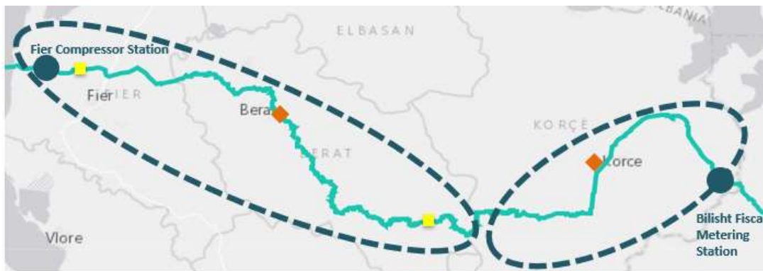
Figura 2: Ndarja e tubacionit në dy zona kryesore

Tubacioni që kalon territorin është rreth 215 km, i cili fillon nga kufijtë jug-lindorë me Greqinë dhe përfundon në bregdetin e detit Adriatik. Tubacioni përbëhet nga dy zona kryesore, zona e Korçës dhe Beratit, Çorovodës dhe Fierit.