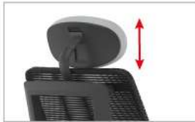
rregullimi i suportit per qafen larte ose poshte.