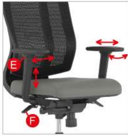
rregullimi i kraheve (4D)