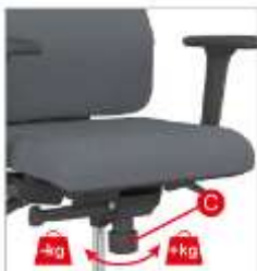
Rregullatori i peshes sipas perdoruesit.