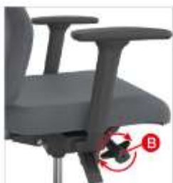
Mekanizmi per ndalimin ne kendin e duhur te perdoruesit.