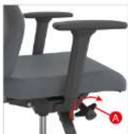
Leva per lartesine.