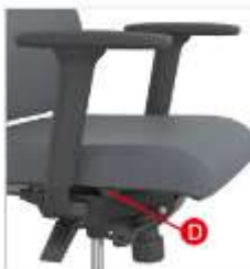
Butoni per rregullimin e thellesise se ndenjeses.