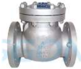
Pamje per orjentim

Valvol moskthimi celiku 4" me flanaxhe , per perdorim ne gazoil. Klasi 150 i flanaxhes. Valvol moskthimi me flanaxhe per tu bashkuar me bulona.