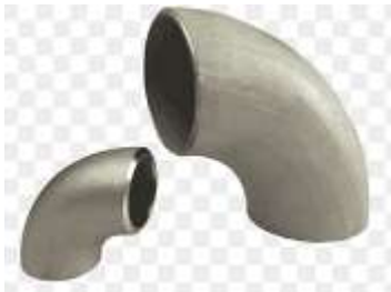
Pamje per orjentim

Bryla celiku 4" te kthyer me kend 90 0 te cilet do te perdoren per bashkimin e tubove aty ku ka kthesa. Brylat duhet te kene veti te mira ne saldim. Te jene i njejti standart me tubot 4" te celikut.