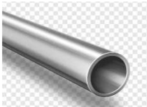
Pamje per orjentim

Berberja e materialit te kete veti te mira per saldim dhe qendrushmeri te mire ndaj korodimit.