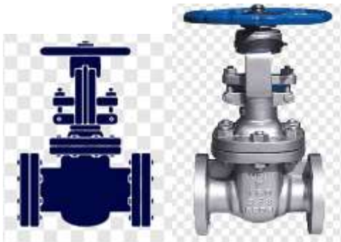
Pamje per orjentim

Valvol celiku 4" me fllanxhe , per perdorim ne gazoil. Klasi 150 i fllanxhes. Valvol (saracinesk) qe manvrohet (hapje mbyllje ) duke rrotulluar volantin. Valvol me fllanxhe per tu bashkuar me bulona.