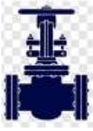
Pamje per orjentim