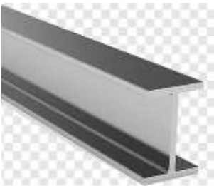
Pamje per orjentim

Profil celiku dopjo T I cili do te sherbej si suport per mbajtjen e sigurte te cdo pjese te struktures.