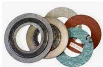
Pamje per orjentim

Guarnicione 4" per hermetizim te gazoilit gjate bashkimeve te flanaxhve. Guarnicioni i klasit per gazoil.