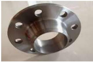
Pamje per orjentim