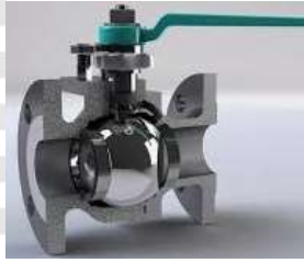
Pamje per orjentim