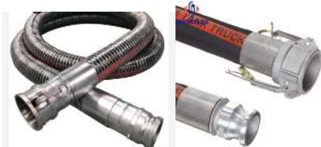
Pamje per orjentim

Tubo gome fleksibel 3” me kapje te shpejte ne te dyja anet. Nga nje ane do te bashkohet me strukturen te cilat duhet te kete dalje qe pershtaten me njera tjetren. Tubo goma ne anen tjetër daljen ta kete per tu bashkuar me autobotin.