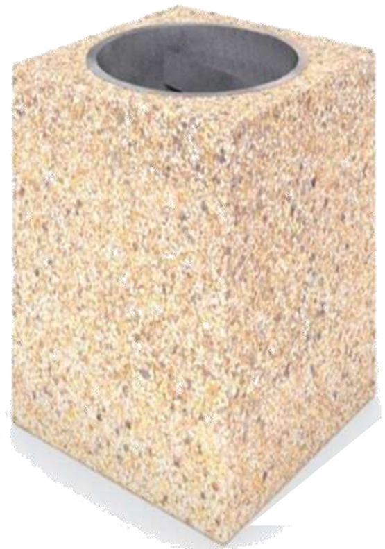
Fig. 1 Ilustrim Kosh betoni dekorativ