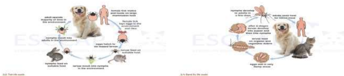
Figure 7 – Disa parazita gjakthithës të përbashkët (rriqëra dhe mushkonja)

(foto ilustruese ne lidhje me parazitet)