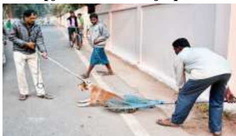
Figure 1– Skenë kapje mekanike të një qeni në Indi (Pati, 2021)