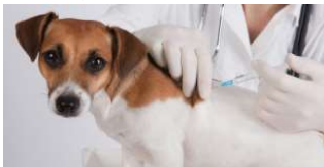
Figure 8 – Biocan R® Vaksinim

Kontraktori gjate kryerjes se shërbimit administron dokumentacionin ne lidhje me ilaçet, vaksinat apo cdo mjet tjetër te përdorur gjate shërbimit si dhe foto te gjithë procesit te mesiperm, te cilat i bashkëngjiten raportit mujor qe dorëzohet prane prane struktures përgjegjëse te ngarkuar për zbatimin e kontrates nga Bashkia Lezhë.