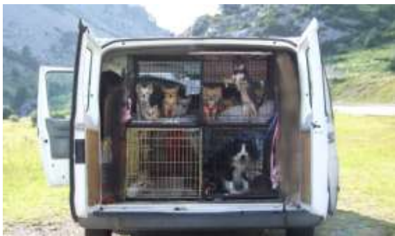
Figure 2 – Si të transportohen kafshët të kapura (Matthews, 2019)