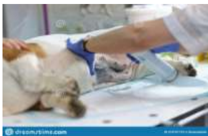
Figure 6 – Trajtimi post operator

(Foto ilustruese mbi trajtimin post operator)