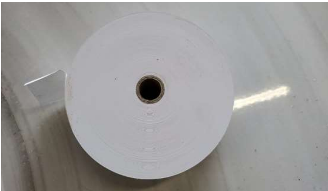
Figura 3. Përmasat e rulonit të biletave elektronike