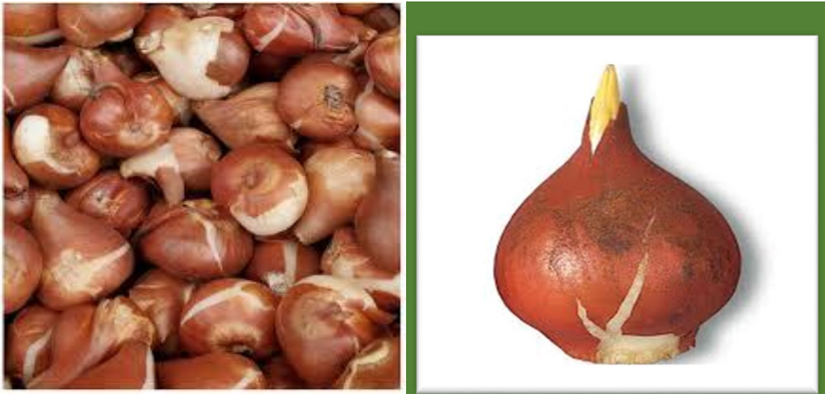
Foto me bulba të tulipanëve të llojeve të ndryshme

Tulipanët (bulbat e tyre) duhet domosdoshërisht të jenë cilësorë, bulba të pa dëmtuara apo të prekura nga kalbëzime të ndryshe, të jenë të pakëtuara sipas llojeve dhe koloreve. Ngjyrat duhet të jenë të verdha, të kuqe, lejla, blu, etj.