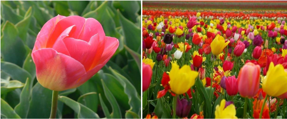
Foto me lloje të ndryshme tulipanësh