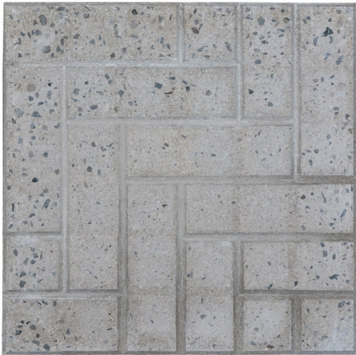
30x30x5.cm dhe 25x25x5.5cm