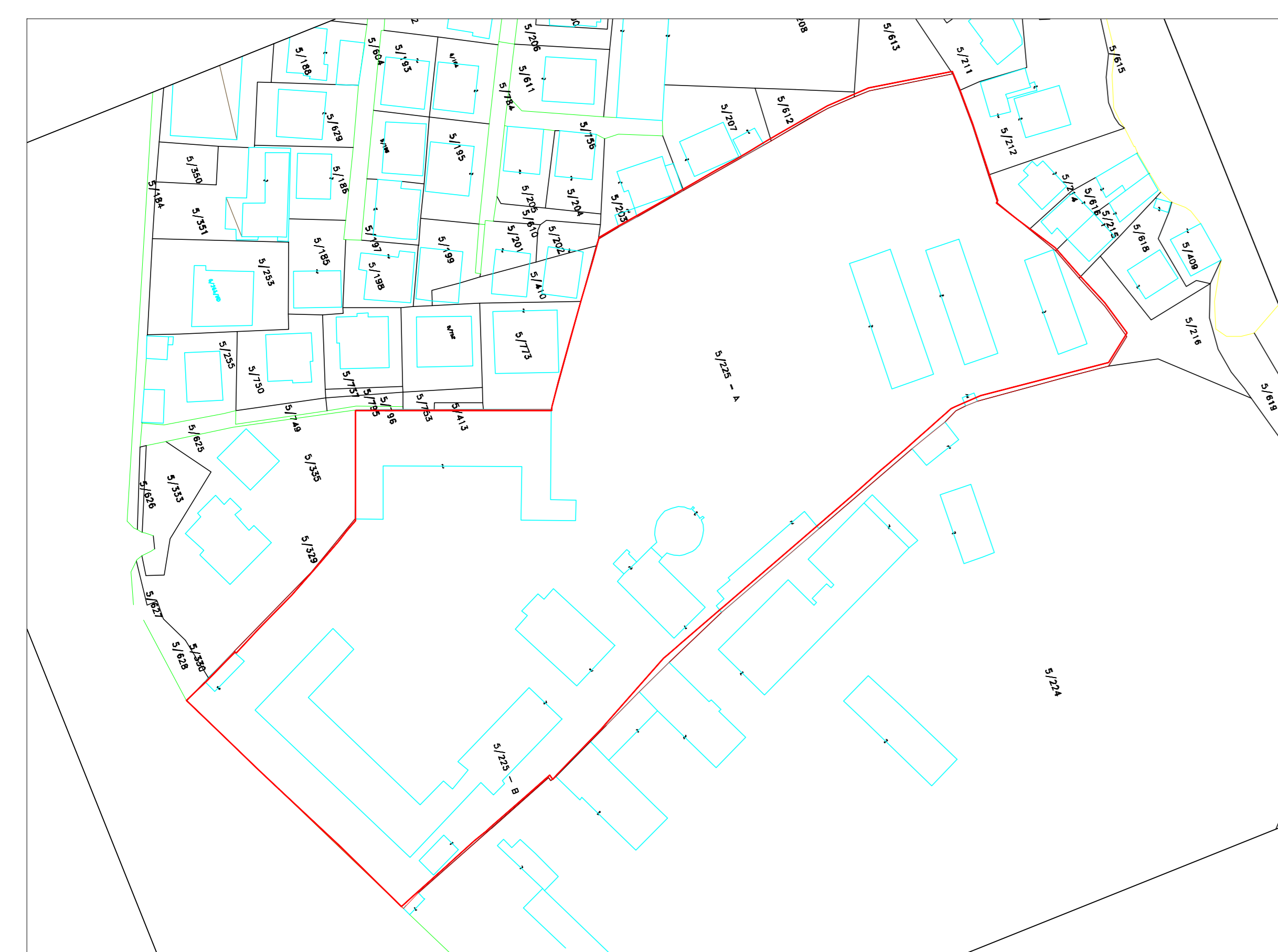
POZICIONI KADASTRAL SHK. 1:1000