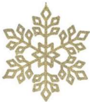
Kambana dekorative 30x30cm