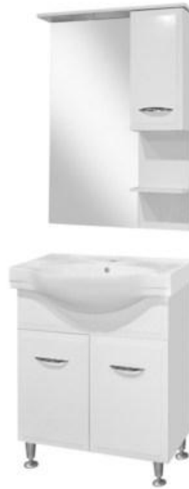
Modeli i Raftit me pasqyre (pa lavamanin)