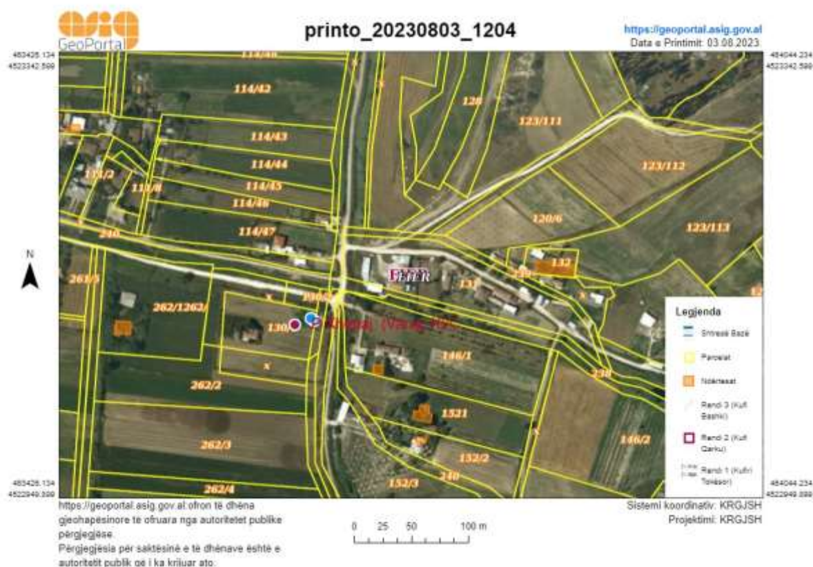
Fig. 1 Planvendosja në google e zones së studimit