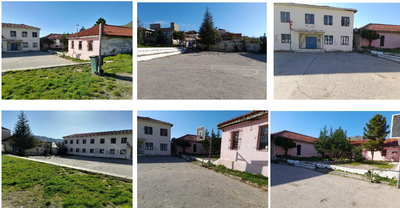
FOTO 2 Foto te gjendjes ekzistuese