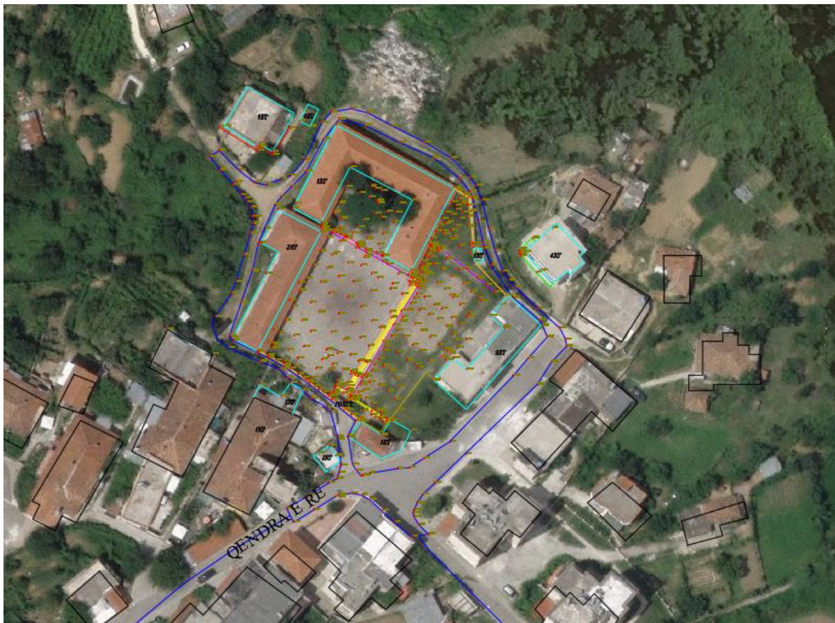
Foto 1 Foto Satelitore e zonës së ndërhyrjeve dhe vendodhja e objektit.

Qëllimi I projektit të propozuar është rindërtimi i Shkollës së Bashkuar Krrabë. Planimetria e vendndodhjes së projektit, kufijtë e projektit të pasqyruar në hartë, koordinatat sipas sistemit Gauss-Kruger, fotografi dhe të dhëna për përdorimin e përhershëm ose të përkohshëm të sipërfaqes gjatë fazës së ndërtimit apo funksionimit të veprimtarisë janë të dhëna më poshtë.