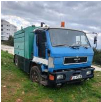
APV MAN Autobot E49 me targa SR6702B viti 1996 shasia WMAE490063L012351