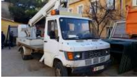
APV Mercedes benz tip kosh 408D me targa AB367HA viti 1991 shasia WD86113181P152749